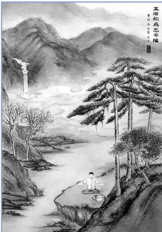
水墨山水画：玉洁松贞志不摧

法轮大法开启了我的智慧，我通过技术创新，为公司每年节约直接成本近一百万元。听老板讲，开始几年的逢年过节，国保警察都来问我的情况。老板每次都讲：“这个人很好啊，工作能力很强，品德很高，非常敬业。”警察后来再也没来过。（文／西南大法弟子）◇