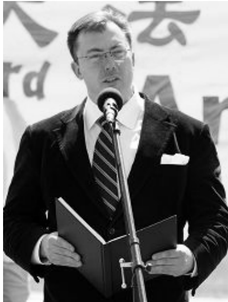
加拿大国会议员罗伯·安德斯