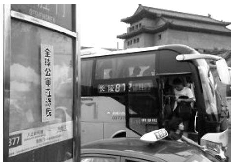
2015 年 6 月下旬，北京街头多处可见“全球公审江泽民”的标语。

退指退党、退团、退队）的事吗？给你个翻墙软件，你可以看到真实的中国和世界。”他说：“谢谢你，不麻烦你了。我会翻墙，我已经在网上退了。”接着又说：“我知道你们炼法轮功的都是好人。我在市公安局上班，是秘书。我没有直接参与迫害法轮功。等你们的李大师回国时，拜托一定替我说句好话，先谢谢你了！一定要帮我把话捎到啊！”◇