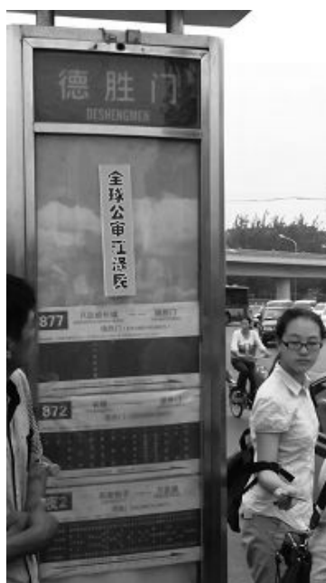
六月下旬，北京街头多处见到“全球公审江泽民”标语。