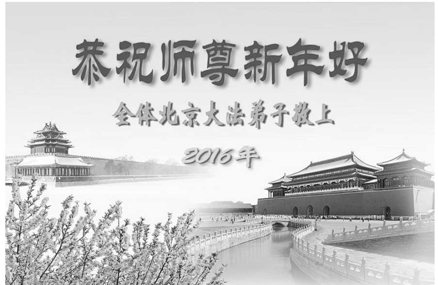
全体北京法轮功学员恭祝李洪志大师新年好！

山东省日照市一位老人对法轮功学员千叮万嘱，一定要代她向慈悲伟大的李老师表达谢意，感谢李老师的救命之恩！携全家向李老师叩首！祝李老师新年快乐！◇