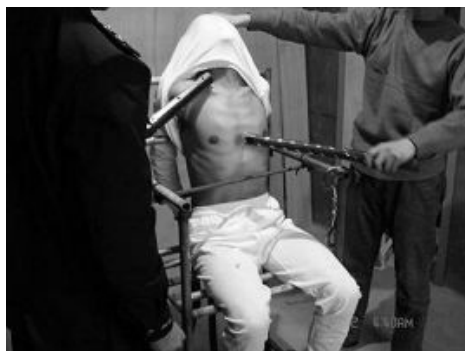
中共酷刑示意图:电棍电击

我想做好人,可现在社会上的是非观念让人难以把握,比如:你做领导不收礼别人可能会说你“装”;你求人办事不送礼别人可能会说你“不懂事”等等。那么有没有超越人类私念、适合全人类的标准呢?我去问我们大学里的博士生导师,去问社会上的乞丐,问庙里的和尚,都没有令人满意的答案。