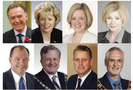
▲ 加拿大各级政要于 2016 年 5 月褒奖法轮大法，祝贺法轮大法弘传世界 24 周年，庆祝“世界法轮大法日”。图为发出褒奖与贺信的部分政要。