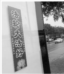
左图：上海街头的法轮功标语