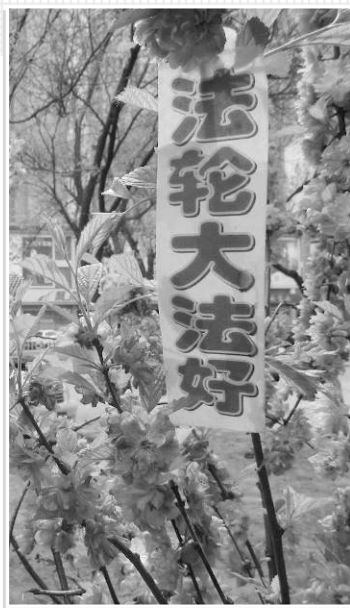
■ 吉林省吉林市街头鲜花丛中的“法轮大法好”标语。（2017年5月）