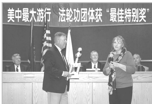
美中最大游行 法轮功团体获“最佳特别奖”

次活动由全球公关集团（The Global Village）主席艾哈迈德·阿卜杜拉赫曼（Ahmed Abdirahman）先生发起，瑞典所有党派主席、内政部长、文化部长、劳工部长、企业部长、一些党派副主席及众多国会议员都参加了此次活动。活动邀请了议会、各社区、智囊团、各种组织、协会、公司、政府部门等五十多个参展单位，瑞典主流媒体现场直播。◇