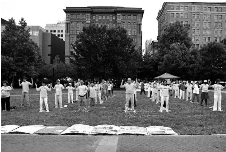
■ 2017年7月23日，费城地区部分法轮功学员在自由钟广场演示功法。

“那8年是我生命中最黑暗的日子”，她流着眼泪说：“我们每天被迫凌晨4、5点就要开始工作直到午