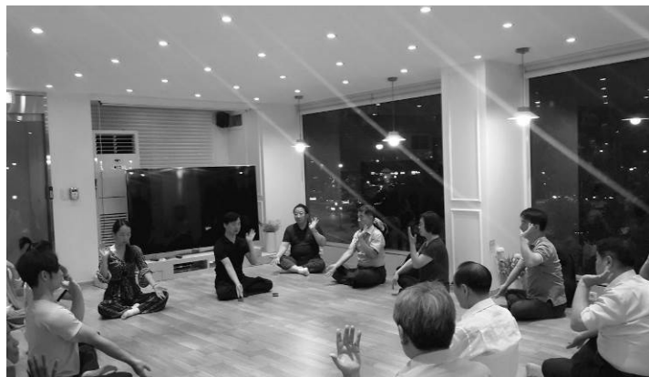
■ 在法轮功学习班上，新老学员们集体打坐炼功。

修炼之前，他在医院接受了痴呆症检查，指数高达10，修炼法轮功后，发现指数竟降为零。对此结果，医生大为震惊，并询问是什么原因引发了这样的奇迹。老先生现在痴呆症症状完全消失了，而且他的变化不止是身体方面的，他说自己以前整天都在抱怨，而现在抱怨