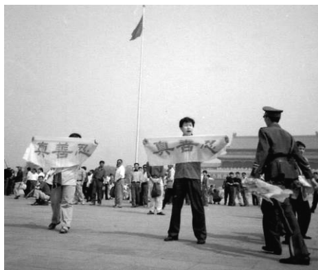
■ 天安门广场的法轮功横幅与警察暴力（摄于2001年5月13日）