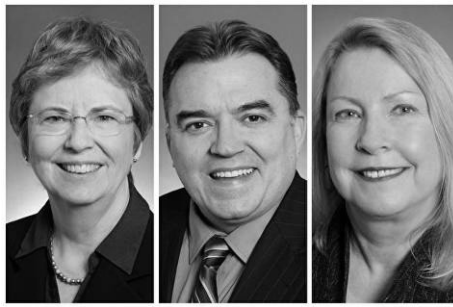
■ 明尼苏达州参议员（41 选区）凯洛琳·丽安，参议员（36 选区）约翰·霍夫曼，参议员（40 选区）克里斯·伊顿

丁俞国 1982 年生，上海浦东新区金桥人，从小品学兼优，个性敦厚。在中共对法轮功的迫害打压最严酷时期，他识破谎言，走入法轮大法的修炼，由原来的体弱多病变得健康有活力。