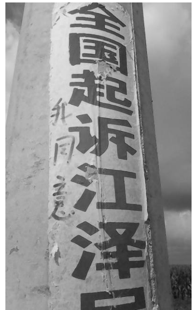
条幅上的民意：『我同意』

■青岛某地一条街道旁的一个电线杆子上贴着一个“全国起诉江泽民”的不干胶条幅，旁边有人写了三个大字“我同意”，表达了百姓的心声。