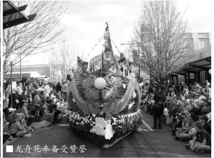
■ 龙舟花车备受赞誉