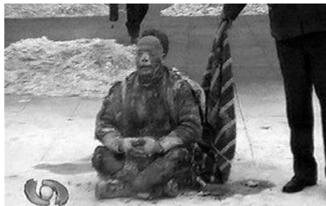
■图为中共栽赃嫁祸法轮功的“天安门自焚”伪案现场图片，“烧不破的雪碧瓶”、“头发烧不着”等等漏洞百出，国际社会已揭示：该事件是由中共政府一手导演的。

警察在所谓走访法轮功学员的过程中，他们亲身了解的情况，使他们自己对“敲门行动”表示反感和无奈，他们通常向法轮功学员表示，“证明一下我们来了，回去交差。”“是上边叫我们走访的，我们只是问问。”“好，就在家炼”等，他们主要是对中共的恐惧，怕受牵连丢饭碗。◇