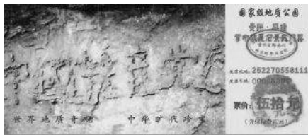
图：贵州平塘县掌布谷国家地质风景公园门票

不管中共怎样掩盖，明白人知道，天意就在眼前。中共几十年来靠谎言与暴力维持政权，通过政治运动败坏人心，摧毁传统