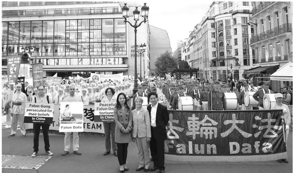
■ 游行出发前法国前部长奥斯塔丽女士与法轮功学员游行队伍合影。

奥斯塔丽女士在演说中还提到，中国是《世界人权宣言》的签署国之一。她说：“《世界人权宣言》第十八条：人人有思想、良知与宗教自由的权利；第三条：人人有权享有生命、自由和人身安全；第五条：任何人不得加以酷刑，或施以残忍、不人道或