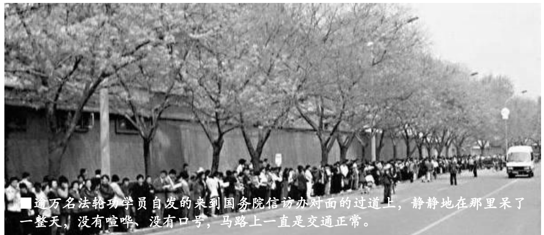
■逾万名法轮功学员自发的来到国务院信访办对面的过道上，静静地在里面呆了一整天，没有喧哗、没有口号，马路上一直是交通正常。

1998年7月，公安部一局发出《关于对法轮功开展调查的通知》，《通知》采取了先定罪、后调查的程