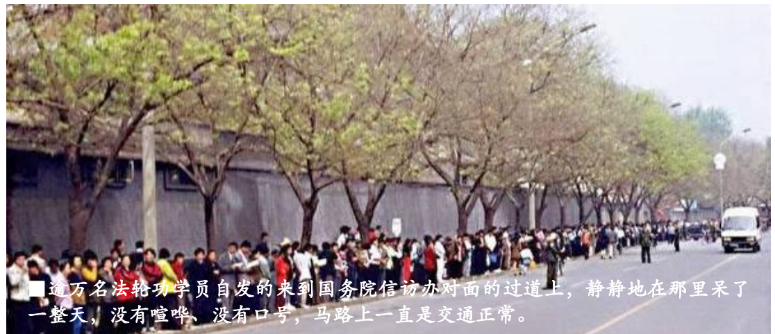
■逾万名法轮功学员自发的来到国务院信访办对面的过道上，静静地在里面呆了一整天，没有喧哗、没有口号，马路上一直是交通正常。

1998年7月，公安部一局发出《关于对法轮功开展调查的通知》，《通知》采取了先定罪、后调查的程