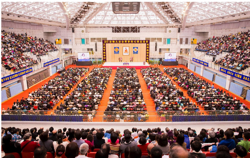
二零一七年台湾法轮大法修炼心得交流会在台湾大学体育馆隆重召开

目前任教于金门一所国小的胡女士，大学毕业后有幸找到真正可以帮助人的办法，就是鼓励对方修炼法轮功。2014年胡女士获选为金门县特殊优良教师，在上台受奖时，胡女士说：“我从害羞的天性到有勇气站在台上，全是因为我遇到了一位伟大的师父，他教我做人要无私无我、先他后我，他就是法轮大法的创始人李洪志老师，李老师，谢谢您！另外，我指导学生三度获得金门科学展览会物理科第一名，也全是因为修炼大法后用‘真、善、忍’的法理来要求自己、指导学生出现的奇迹。”