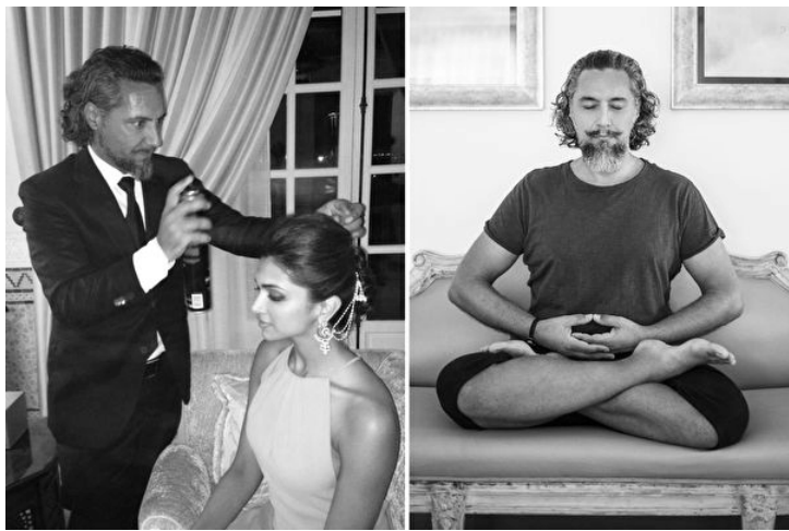
■左：作为著名发型师的乔尔吉欧为宝莱坞影星迪皮卡·帕度柯妮打理头发。右：乔尔吉欧在家中打坐。