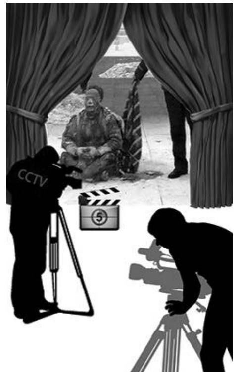
■ 中共导演天安门自焚案

小叔子刚知道我炼法轮功，吓坏了，单独找他哥说，不行，离婚吧。他怕我杀他哥和孩子，更怕影响他们的前程，俩口子跟我大喊大叫，不让我炼，说他们的所长因炼法轮功被迫害死了。在后来的接触中，他们看到我的变化：经常看到我去看公婆，直到婆婆去世，买墓地，我们拿了大部