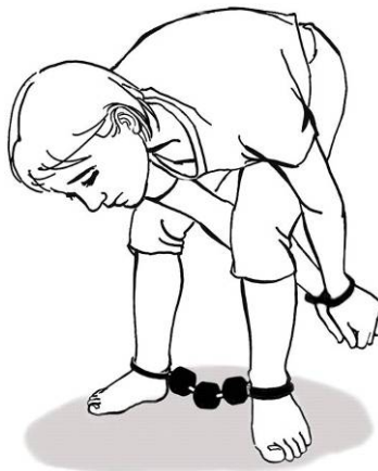
■ 酷刑演示：手铐脚镣

我每天24小时被强制戴脚镣和手铐，不准下床活动。由于我要求上诉，双手曾被一字型铐在床上20多