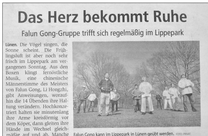
■ 图：三月三十一日，德国《周末信使报》报道法轮功学员在绿嫩市丽波公园集体炼功。

绿嫩市的小鸟在鸣叫歌唱，阳光普照大地，上周日丽波公园的空气格外的清新。小音箱里面传来东方的音乐和一个东方男士，法轮功创始人李洪志的声音，