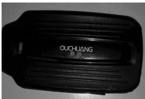
■在法轮功学员的三轮车底部发现的跟踪定位仪

此外，中共还用跟踪定位仪监视法轮功学员。2018年传统新年过后，华北地区一位农村法轮功学员在自家的三轮车底部发现了一台跟踪定位仪。在对法轮功学员的跟踪、监控中，中共采用高科技，手段卑鄙和邪恶。◇