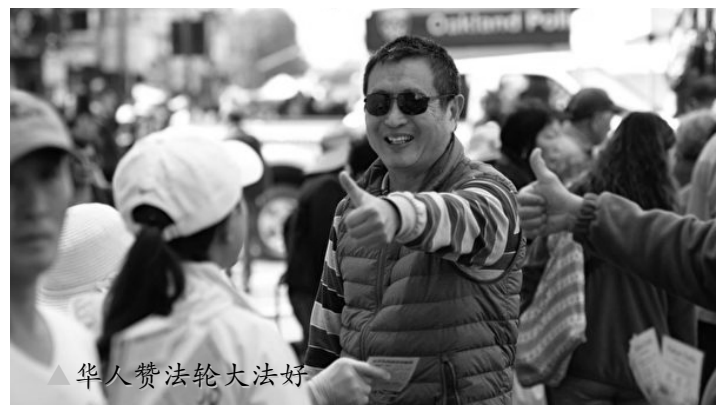
▲华人赞法轮大法好