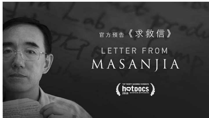
▲纪录片《求救信》的官方中文版预告片。

求救信是向地球的另一端发出请求帮助的呼吁。墨西哥纪录片电影节的宗旨是“给那些没有被人听到