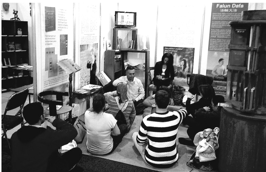
■在书展上，络绎不绝的人群来到法轮功展台参观学炼功法

来到法轮功展台，炼完功后，他告诉学员：“我过来的时候，就看见法轮功展台有能量在转动，这种机会可遇而不可求，所以我马上学炼功法。我近几年一直在寻找修炼的机缘，非常感谢你们！”