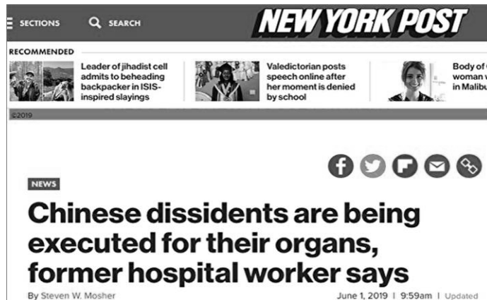
《纽约邮报》 文章网站截图

象乔治这样亲眼目睹活摘器官的情况非常罕见。去中国的“移植游客”不会被告知他们的新心脏、肝脏或肾脏来自哪里。那些器官被