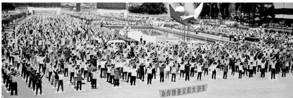
▲1999 年 7 月法轮功被迫害后，有成千上万法轮功学员去北京上访，为了不连累单位和家庭，众多上访的法轮功学员被关押后，因不报姓名而失踪。图为 1998 年广州一个法轮功炼功点的学员们在晨炼。

中共强摘器官有两个原因：消灭让（中共）讨厌的少数群体，并获得巨额利润。中国的器官移植流水线不仅仅是谋杀，也可能是一种群体灭绝。◇