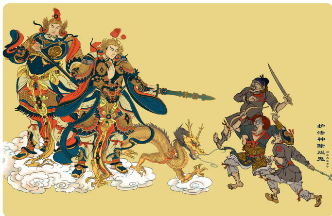
▲ 美术作品：护法神铲除共产邪灵烂鬼

后来又有一个犯人借故找我麻烦，用铁锹拍我的头顶，我就两眼直视打我的犯人。我们都戴着头灯，我可以清楚地看着他的脸，我直