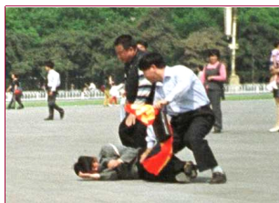
中國政府僱傭地痞流氓對法輪大法學員進行殘酷迫害。2000年6月25日，北京天安門廣場

★ 99年9月8日，在北京昌平收容所，為保護《轉法輪》一書不被公安人員搶走，8名學員輪番撲倒在書上，20名公安人員用警棍、手拷逐一將他們殘酷拷打。有的頭部、胸部被打傷，有的手腕被卡得鮮血淋漓。這場拷打從上午持續到下午，8名學員打不還手，罵不還口。周圍的犯人都感動得哭了，公安人員打得汗流浹背，氣喘吁吁。最後，他們被8名學員的行為所感動，有的眼含着熱淚豎起大拇指說：你們是不要命的好人！書，你們看吧，我們不要了。