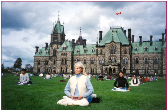
加拿大學員在國會大樓前草坪上煉功，敦促加拿大政府對中國鎮壓法輪功予以關注。

的信息反饋。我們不相信中華人民共和國竟會對這些無辜的生命置之不理，但擺在我們面前