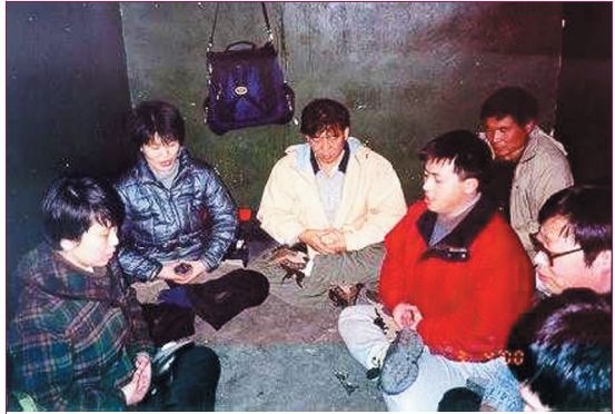
因履行公民上訪權利上訪被捕的法輪大法學員被拘留于北京郊區的一拘留所。在極其惡劣的環境下，他們仍然堅持集體煉功。2000年3月，中國北京。

在此之前犯人們大部份沒有聽說過法輪大法，我進去之前她們都根據輿論宣傳的導向寫的認識，我進去後她們看到我是一個實實在在的好人，我還不斷向她們介紹修煉的真實情況，她們由開始的好奇到逐漸地瞭解，發現電視宣傳都是假的，竟有一半多人表示想修煉大法，很多人跟我學打坐，我也覺得有意思，我煉了幾個月才能盤上幾秒鐘，她們大多數能盤得很好。師父說：法度有緣人。無論她們以前做過什麼，難得生逢大法弘傳之世，我真的希望她們能夠在大法中修煉，只有大法才能真正挽救一個人的生命。在我以後又進來過5個“新來的”，她們都沒有受到欺負，一個做值日有6~7個幫助。犯人們基本上已不罵人不說髒話了，我臨走時一個犯人指着我對大家說：“她不會罵人，我在她跟前不敢罵人，想罵人臉就紅，不好意思罵不出口了。”上課時我旁邊坐着的女孩天天與我聊天，她說：“人們都說，好人進了監獄也得學壞，我在里面卻學會了如何做好人。”