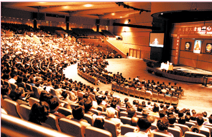
澳大利亞法輪大法心得交流會,1999年5月,悉尼

美東時間1999年11月18日,美國眾議院全體通過了批評中國政府違反國際基本人權的決議案。11月19日星期五下午,美國參議院也通過了有關決議案。兩項決議案均旨在要求中國政府遵守自己簽署的國際人權公約,停止對法輪功學員的逮捕、關押和迫害,釋放因信仰不同而被關