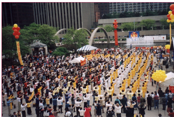
加拿大慶祝法輪大法弘傳7周年，圖為在 多倫多城市廣場 的慶典。1999年5月22日