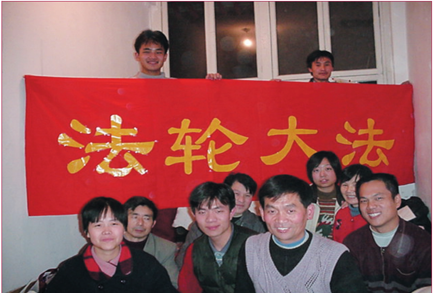
到天安门广场去，微笑地面對磨難，法輪功學員的勇氣令人欽佩