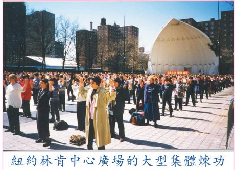
紐約林肯中心廣場的大型集體煉功

總之,在 4.25 中南海事件中,法輪大法學員決不是因為“忍不住”而去“圍攻”中南海,而是祥和地去進行合理合法的上訪。事後的 1999 年 6 月 14 日,中國各大官方媒體同時發佈的《中辦、國辦信訪局負責人接待部分法輪大法上訪人員談話要點》就是這次合法上訪行動的官方證明。政府明確使用“上訪”一詞。當時,法輪大法學員在上訪中表現出的優良素質,和中國政府當時的開明做法,都曾受到外界的好評,認為是中國民主進步的表現。想不到,數月之後,這麼一件好事,被中國一部分領導人,因為個人晦暗的政治需要,運用所控制的宣傳機器,歪曲成了顛覆政府的行動,成了迫害、取締法輪大法的藉口,使中國在政治上倒退到了有些做法比文革還要過份的黑暗年代,使數千萬法輪大法學員的生存受到嚴重威脅。