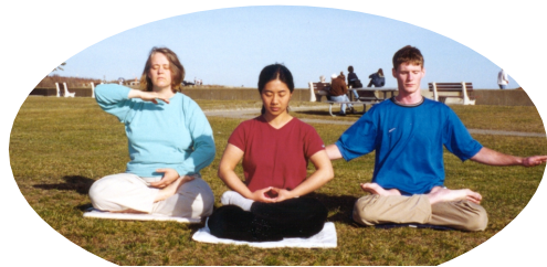
Wallis 海灘公園煉功，2000年 4月1日，美國新罕布什州

濫用精神病治療法(監察)委員會： 敦促世界精神病協會調查中國使用精神病院鎮壓法輪大法，濫用精神病治療法(監察)委員會要求美國精神病協會董事會敦促世界精神病協會調查法輪大法學員被關押在精神病院及受折磨的報告。在該委員會的陳訴中，“(委員會)對眾多的‘強制關押’非精神病患者的法輪功學員的報告表示憤怒，強烈要求董事會正式提請世界精神病協會對這一事實進行調查。由亞特蘭大 VA 醫療中心 Renato Alarcon 醫生任主席的該委員會，負責美國精神病協會的職業道德。