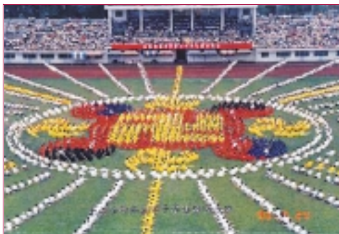
1998年6月24日武漢地區法輪功學員心得交流會，圖為學員的集體煉功場面

人傳人，心傳心，是法輪大法的主要傳播方式。大家都是自己學了覺得好，便告之于親朋好友，從而一傳十，十傳百。法輪大法的各種講座，教功，學習班均對大衆免費開放，學員自願義務服務教功。