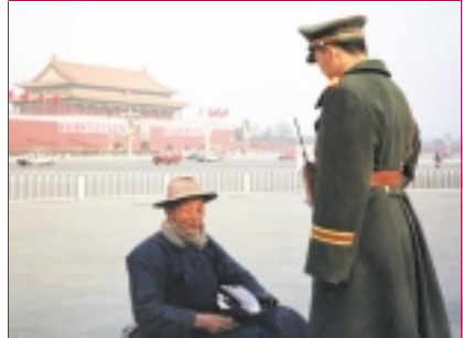
就連過路休息的老翁也要被詢問“是不是煉法輪功的？”

在被鎮壓以前，是中國政府大力推崇的健身功法。各級政府對法輪大法及其創始人李洪志先生多次褒獎。然而，風雲突變，僅僅出于中國某些領導人的政治需要，自99年4月25日以後，中國政府逐步開始了對法輪大法的全盤否定，進而進一步鎮壓，並開始了對法輪大法修煉者及其創始人的全面迫害。