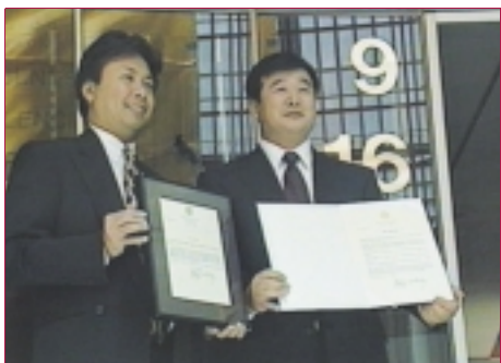
美國伊利諾州長致函嘉獎李洪志先生，財務長授予李洪志先生“杰出服務獎”；芝加哥市長將1999年6月25日定為“芝加哥李洪志大師日”

創始人李洪志先生曾多次獲中國政府及有關部門的獎勵，法輪大法也曾被中國政府推薦為全民健身的好功法。