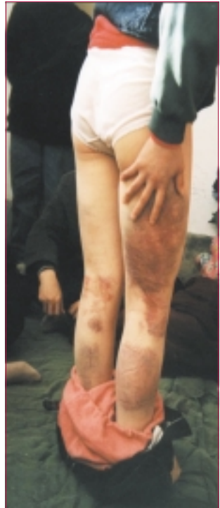
來自江西的劉女士，2000 年 1 月 2 日因上訪被拘留于天安門警察局，遭到嚴刑拷打，全身傷痕累累。

1999 年 12 月 22 日至 25 日，初冬的山東，北風呼嘯，穿心透骨，寒氣逼人，氣溫在 0℃ 以下。廣饒縣政府將某村去北京逮捕後送回的 4 個法輪大法學員遊街 4 天，其他 2 個法輪大法學員遊街 2 天。