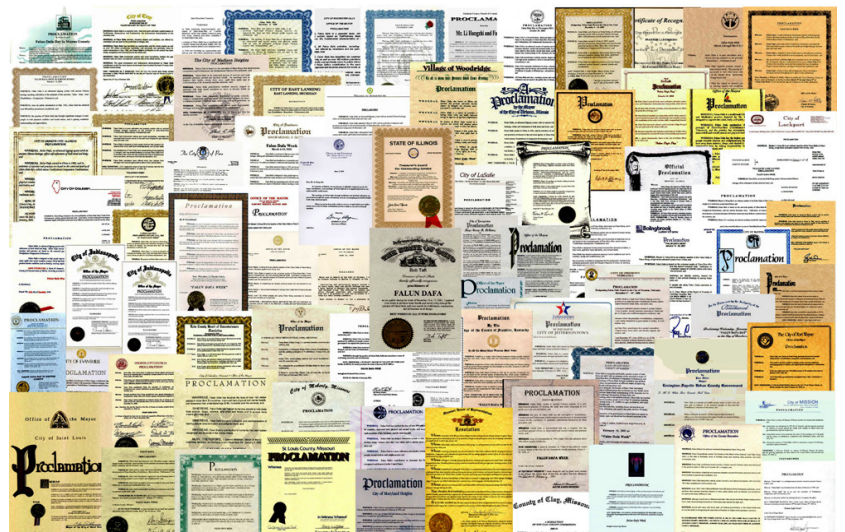
法輪大法來自美國各地的褒獎 —— 美中地區。