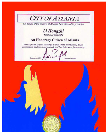
1999/9/3 美國亞特蘭大市市長宣布：李洪志，為該市榮譽公民。

11999 年 7 月以前，中國政府鑒於法輪大法使廣大民眾獲得身心健康，為國家節省大筆的醫療費用，曾多次給予李洪志老師獎勵表彰，法輪大法也被政府推薦為「全民健身的好功法」。並曾在《人民公安報》、《中國經濟時報》及《上海電視臺》等多家媒體上報導。