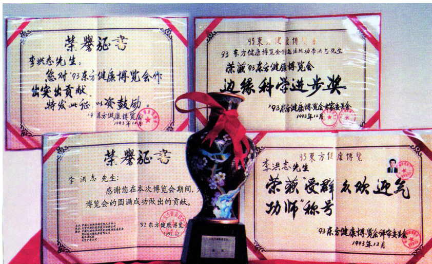
李洪志先生獲 93 年北京東方健康博覽會唯一最高獎項「邊緣科學進步獎」和大會的「特別金獎」、「最受歡迎的氣功師」。

在海外，李先生及法輪大法榮獲許多國家和各政府的褒獎達 900 多項。正如美國德州休斯頓市市長獎狀中所寫：「法輪大法超越文化，超越種族界限，將宇宙真理播向世界各個角落，架起了東西方交流的橋樑。他的教導打動了無數人的心靈，贏得了舉世贊譽……」