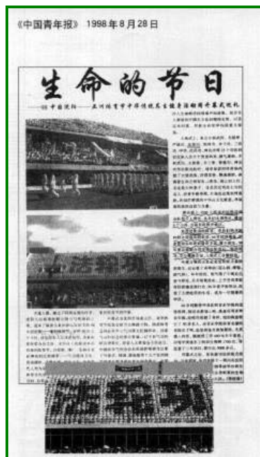
右图《中国青年报》：法轮功学员在亚洲体育节开幕式上