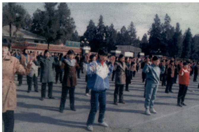
左为修炼者在河北剧场炼功；右为青年学员 在华北烈士陵园门口广场炼功。 石家庄