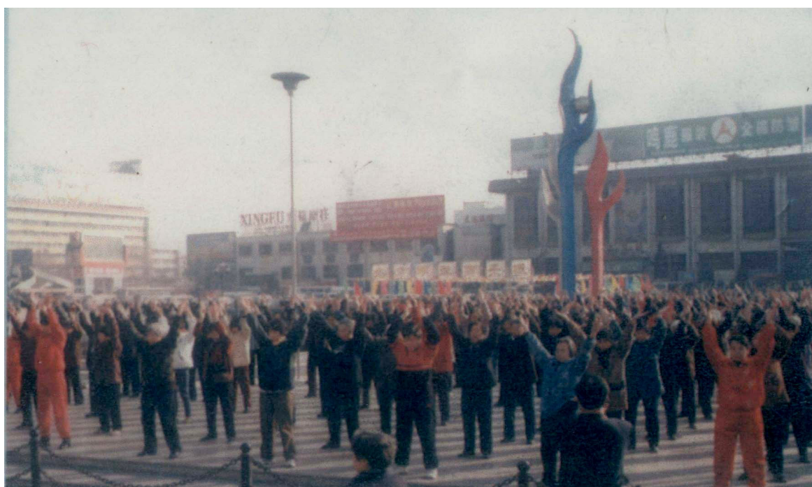
法轮大法修炼者在石家庄火车站广场炼功 1998 年