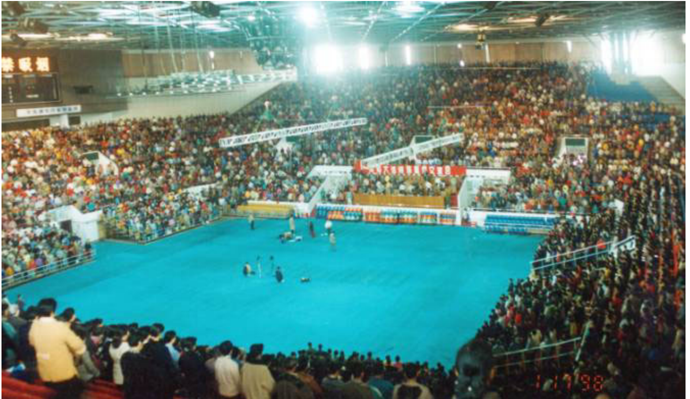
在广州举行的万人法轮功修炼心得交流会。中国，广州（1998）