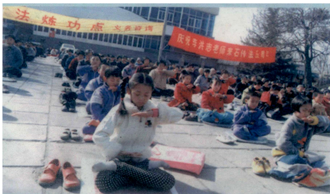
小学员在石家庄青少年宫广场炼功