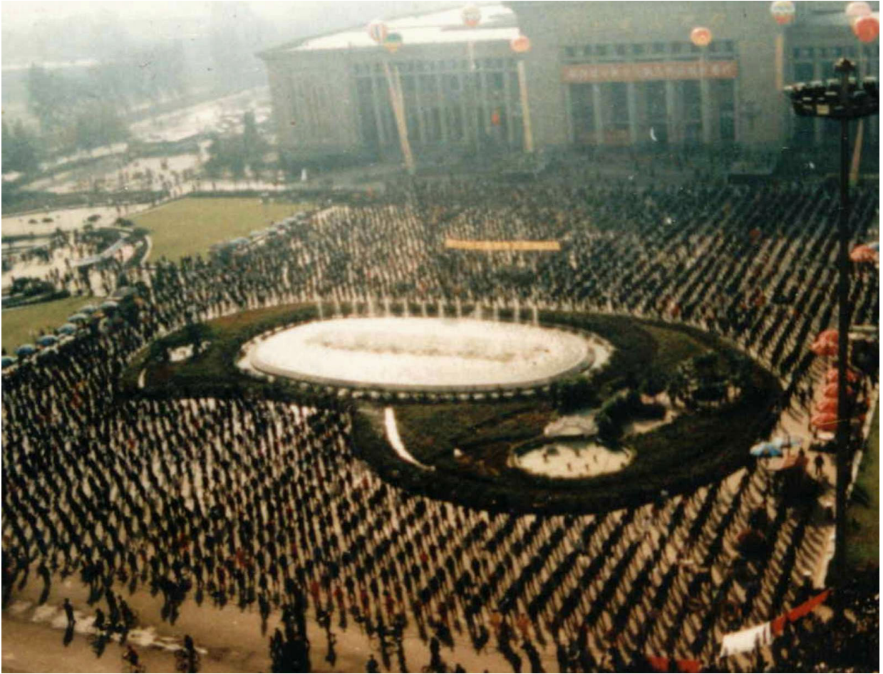
1998 年“10.1”法轮大法修炼者在河北省博物馆广场炼功，九千多人参加。 石家庄