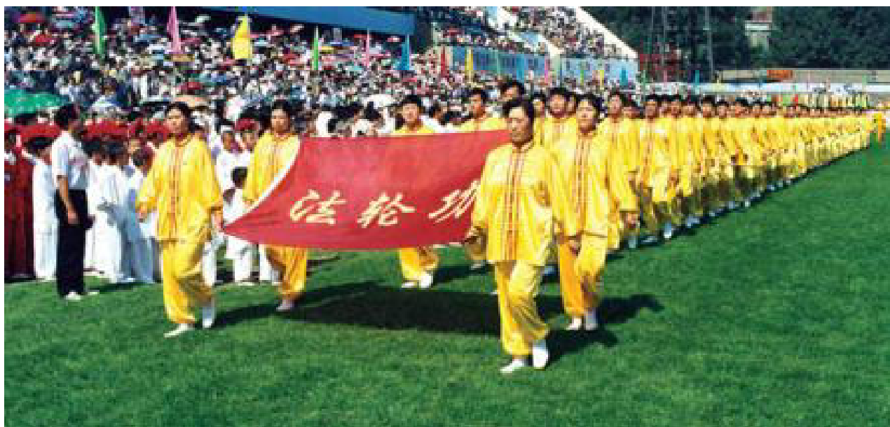
法轮功学员在亚洲体育节开幕式上列队入场。中国，沈阳(1998)