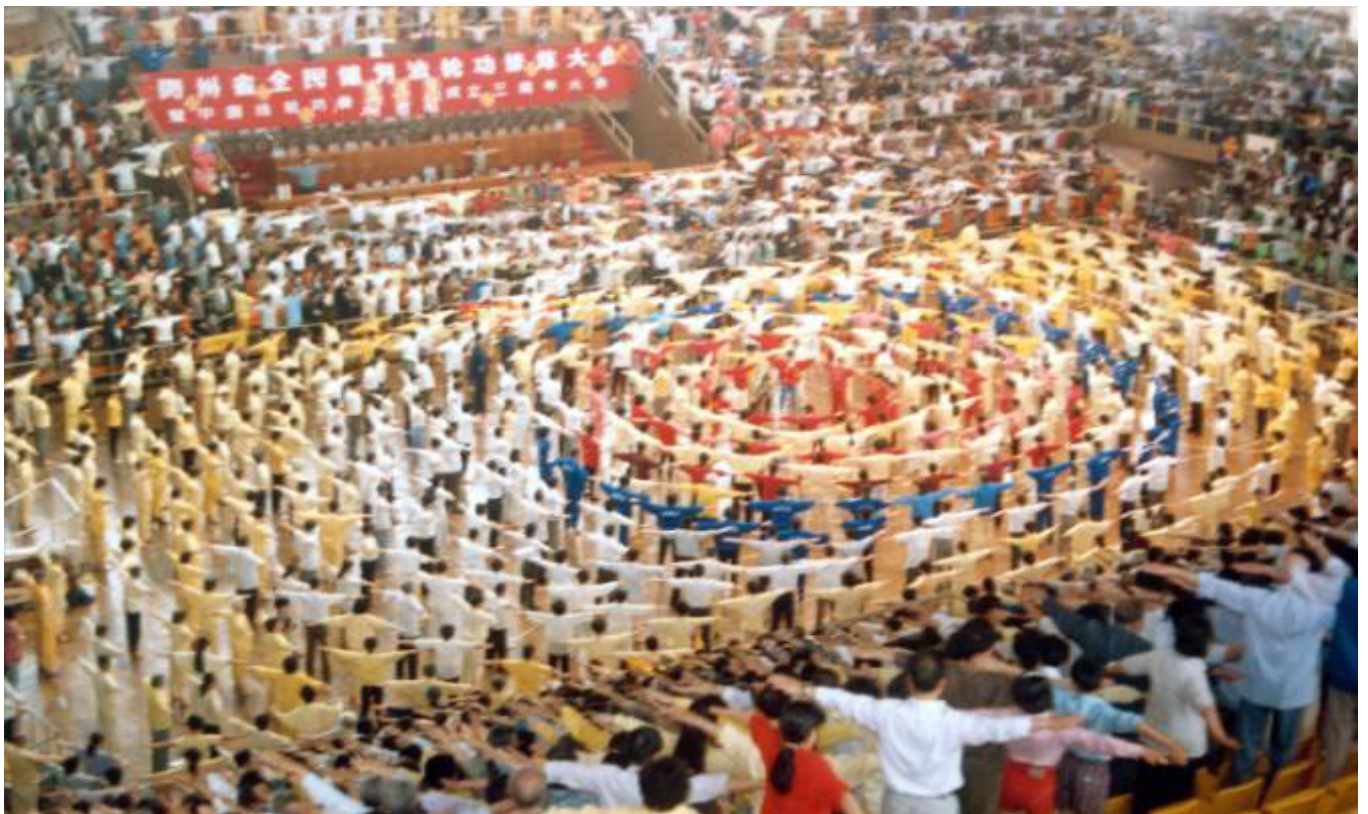
在贵州举行的法轮功修炼心得交流会。 中国，贵州 1998