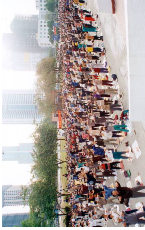
李洪志在北京办过三轮法轮功，北京(1998)