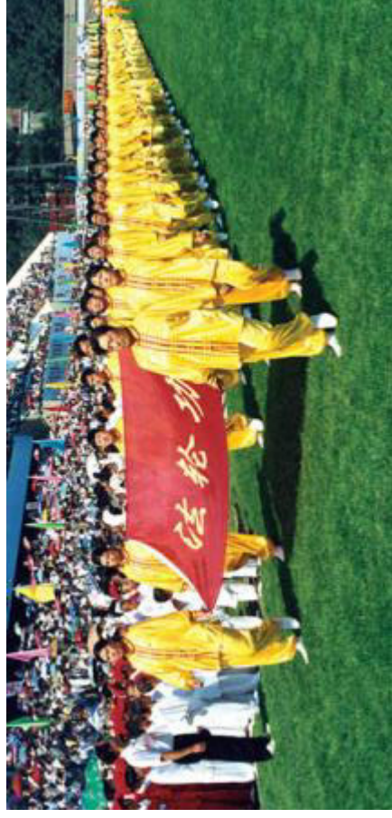
法轮功学员在亚洲体育节开幕式上列队入场。中国，沈阳(1998)