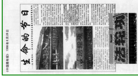
右图法轮功学员在亚洲体育节开幕式上