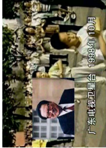
广东电视卫星台 1998年10月