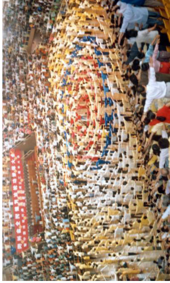
在贵州举行的法轮功修炼心得交流会。中国，贵州 1998