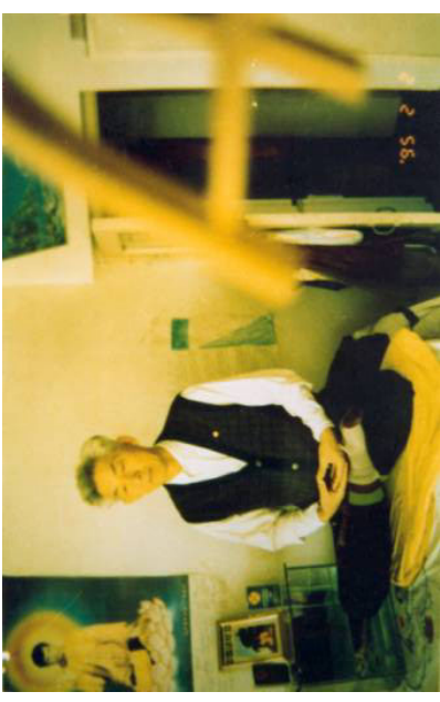
天梯——法轮功学员在炼功时所出现的奇妙景象。照片中的金色梯子是在房间里本不存在的。（中国）