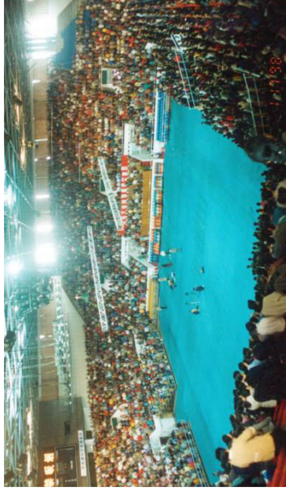
在广州举行的万人法轮功修炼心得交流会。中国，广州（1998）