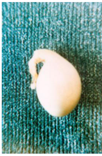
带把的鸡蛋：一人告诉他妻子：“如果鸡蛋有把，我就修法轮大法。”第二天，他们家的鸡就生了个带把的鸡蛋。