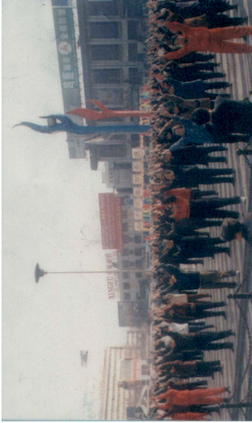
法轮大法修炼者在石家庄火车站广场炼功 1998 年