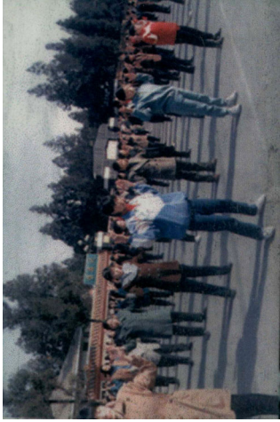
左为修炼者在河北剧场炼功；右为青年学员在华北烈士陵园门口广场炼功。 石家庄