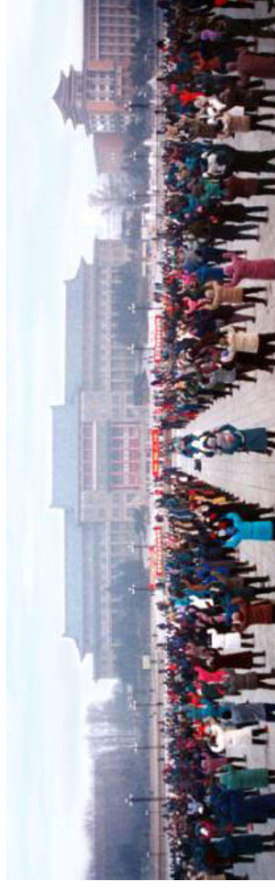
李洪志老师在大连共举办过两期法轮功传授班。法轮功在大连地区蓬勃发展。这是大连第三次修炼心得交流会。中国大连（1998）