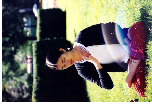
美国法轮功学员在公园炼功时拍到的能量场。