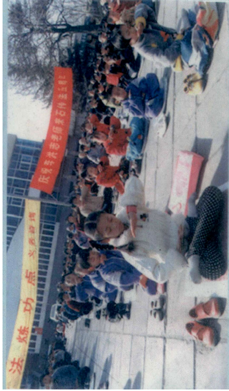
小学员在石家庄青少年宫广场炼功