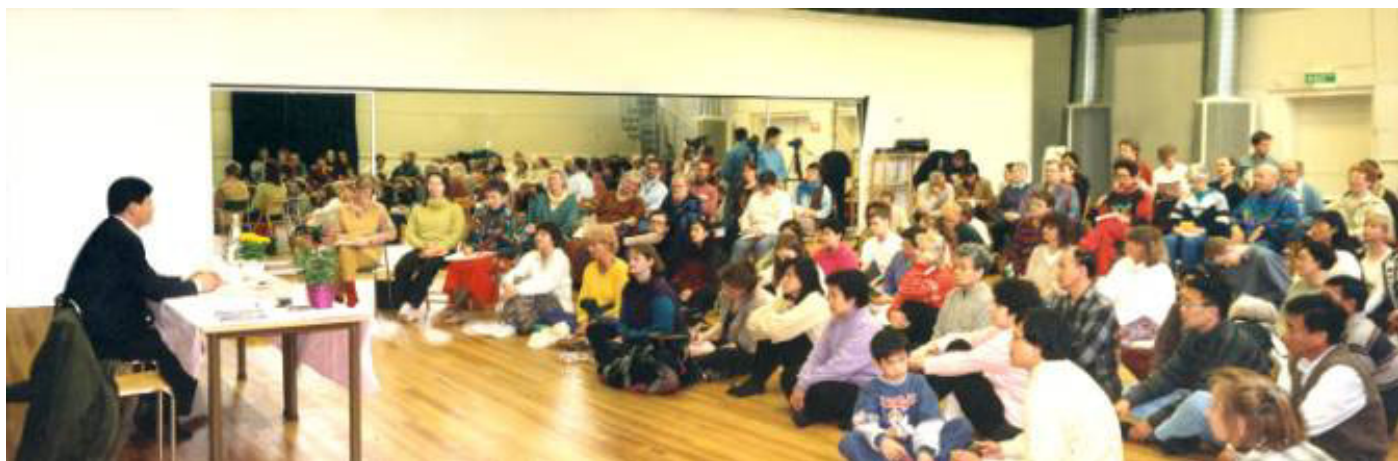
李洪志老师于 1994 年底结束在中国的讲法传功后， 于 1995 年在瑞典举办法轮功传授班。 瑞典(1995-4)