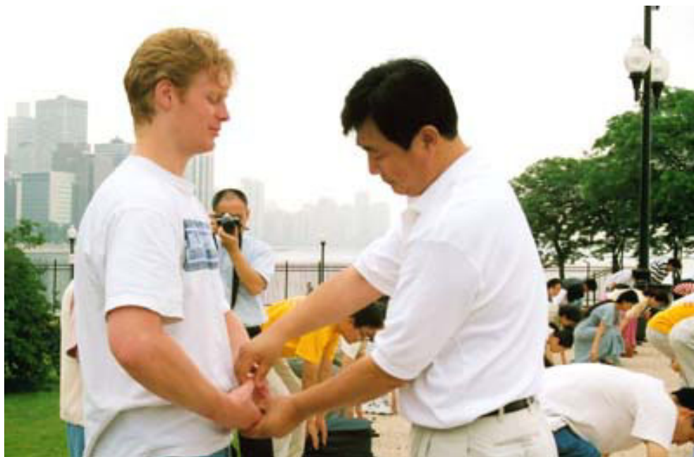
李洪志老师给参加晨炼的学员纠正动作 美国，芝加哥