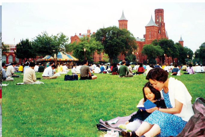
加拿大的小学员在和母亲一起学法