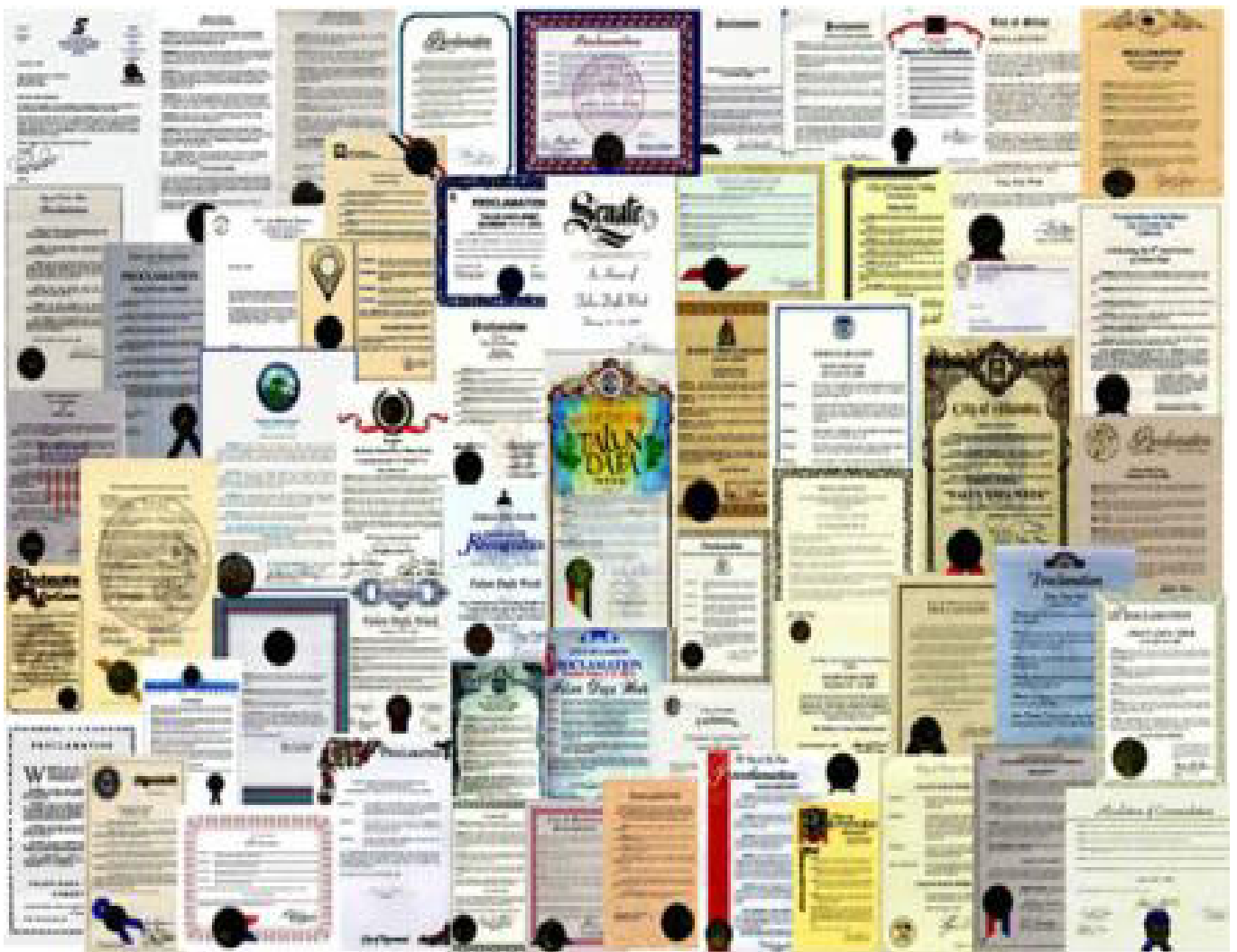
来自世界各地的褒奖（部分选登）

法轮大法自 1992 年 5 月公开传出以来，短短的几年时间里，在全世界吸引了上亿人修炼，学员遍布 60 多个国家。法轮大法的修炼不求名、不求利，以“真善忍”为准则。无论男女老幼，无论来自哪个国家、民族，只要坚持修心炼功者无不深深受益。与此同时，法轮大法在世界范围正在得到各级政府、组织和民众越来越多的理解和珍视，迄今为止，法轮大法和他的创始人李洪志先生已经获得了 1000 多个来自世界各地的褒奖。