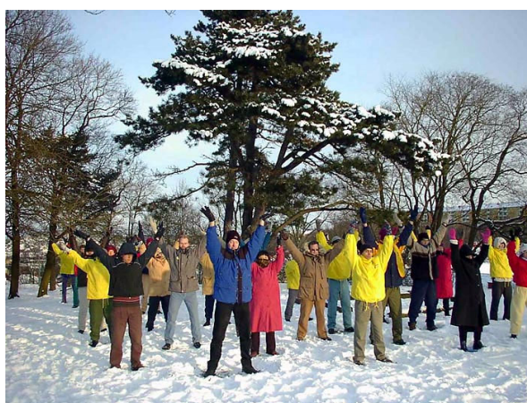
瑞典法轮功学员在集体炼功