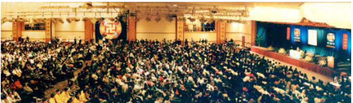
李洪志老师在 1999 年纽约法会上讲法。 美国，喜来登饭店帝国厅(1999-3-23)