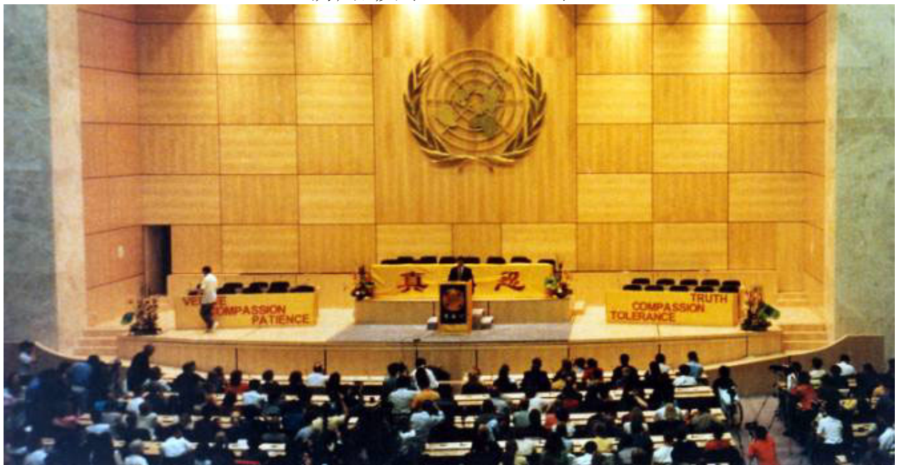
李洪志老师在瑞士法轮大法修炼心得交流会上讲法。 瑞士，日内瓦，联合国万国宫(1998-9-4)