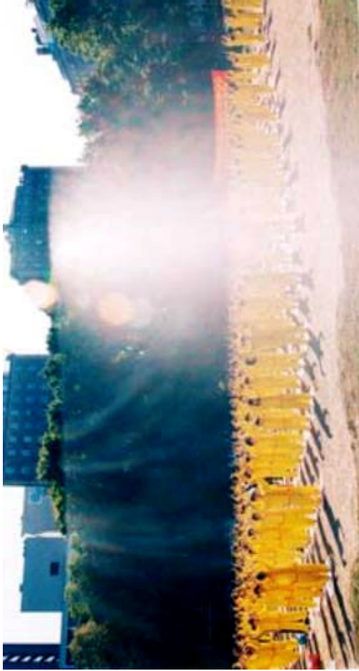
500 多名法轮功学员在纽约中央公园东 97 街集体炼功时拍到的能量场。美国，纽约中央公园 (1998-10)