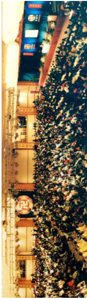
李洪志老师在 1999 年纽约法会上讲法。 美国，喜来登饭店帝国厅 (1999-3-23)