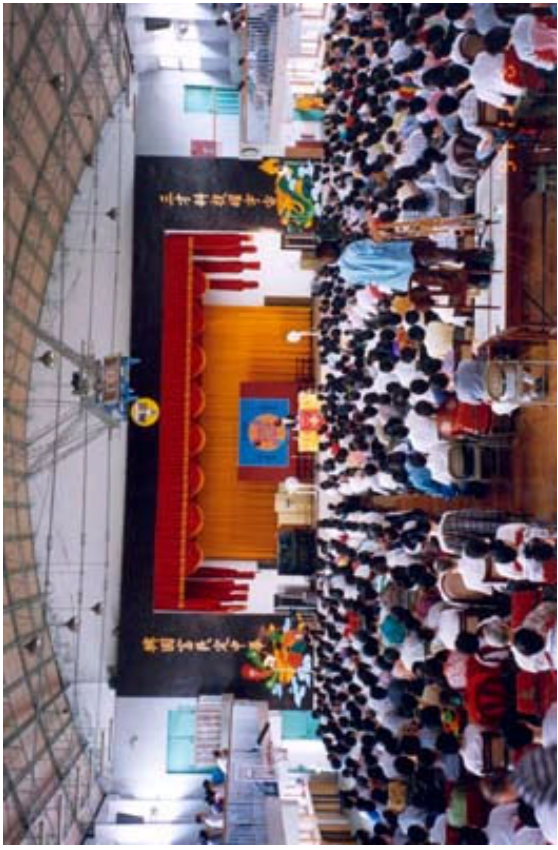
李洪志老师首次赴台湾，并在台北讲法。台湾，台北市 (1997-11-16) 台湾修炼法轮功的人数从 1999 年镇压开始时的 3 千人左右增至现在的 30 多万人，学员遍布台湾的 21 个县市，从政府官员、大学教授、医生律师、到家庭主妇、小学生，各行各业、各族群年龄都有人修炼法轮功。