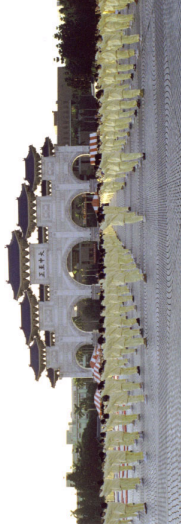
下图为台湾法轮功学员在集体炼功。