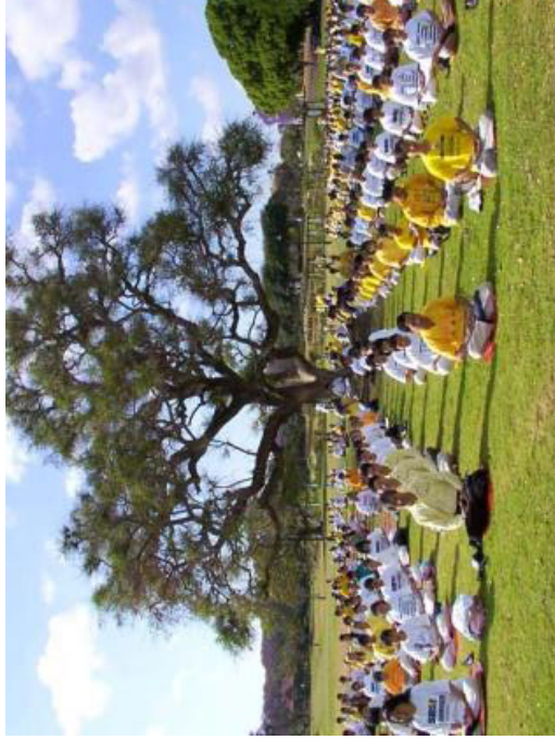
学员在澳大利亚召开的亚太地区心得交流会期间炼功（2001-10）