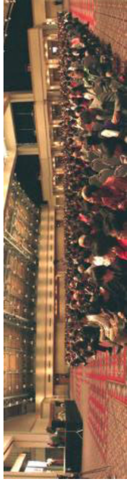
2002-12，美东法轮功学员心得交流会在费城隆重举行。