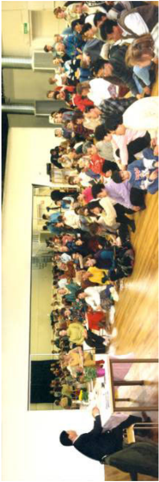
李洪志老师于 1994 年底结束在中国的讲法传功后， 于 1995 年在瑞典举办法轮功传授班。 瑞典(1995-4)