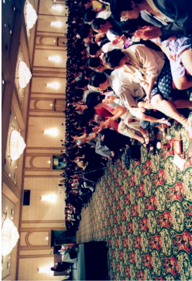
李洪志老师在芝加哥法轮大法修炼心得交流会上讲法。 美国，芝加哥 1999-6-26