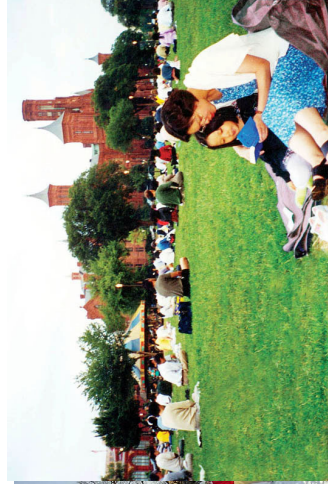
加拿大的小学员在和母亲一起学法