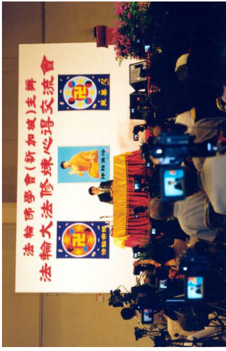
李洪志老师在新加坡法轮大法修炼心得交流会上讲法。 新加坡 (1998-8-22)