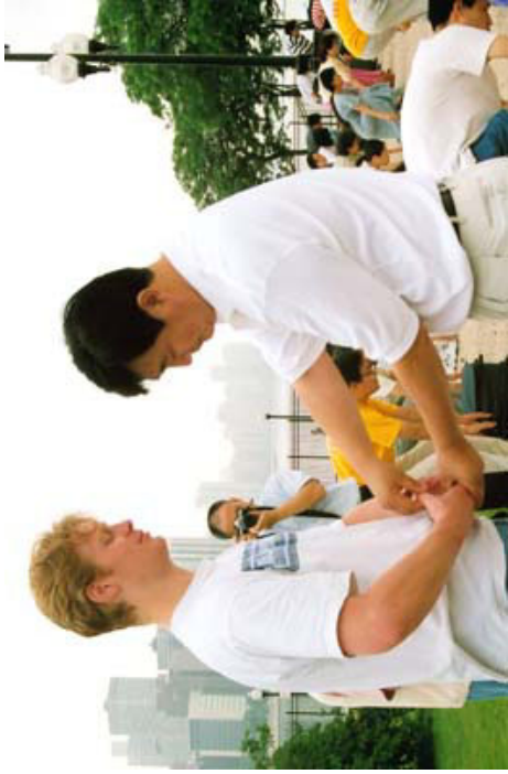
李洪志老师给参加晨炼的学员纠正动作 美国，芝加哥