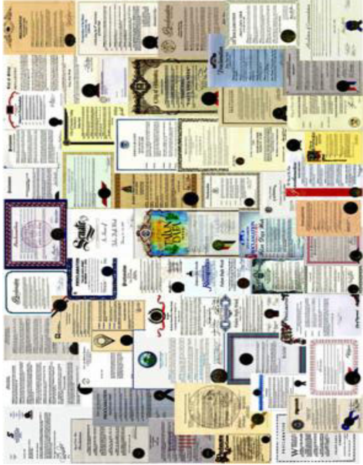
来自世界各地的褒奖（部分选登）

法轮大法自 1992 年 5 月公开传出以来，短短的几年时间里，在全世界吸引了上亿人修炼，学员遍布 60 多个国家。法轮大法的修炼不求名、不求利，以“真善忍”为准则。无论男女老幼，无论来自哪个国家、民族，只要坚持修心炼功者无不深深受益。与此同时，法轮大法在世界范围正在得到各级政府、组织和民众越来越多的理解和珍视，迄今为止，法轮大法和他的创始人李洪志先生已经获得了 1000 多个来自世界各地的褒奖。