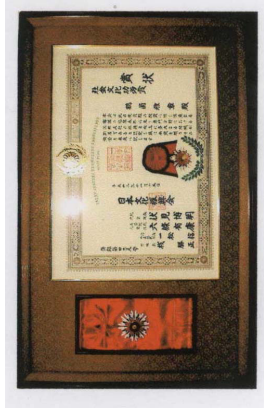
左图为台湾国防部中部地方军事法院检察署看守所致台湾法轮大法学会感谢状，上书“功德无量”来表彰法轮功学员义务教功，协助教化，使受刑人身心方面改善。右图为来自日本的褒奖。