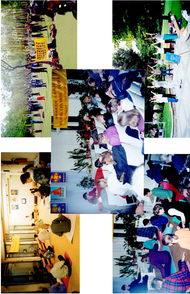
法轮大法在俄罗斯洪传。 俄罗斯 (1998)

统计资料显示，在北美的法轮功修炼者相对年轻且有很好的教育背景，修炼法轮功使健康有很大改善：修炼后，有的慢性疾病完全消失，有的病情显著减轻，吸烟者戒掉了烟。炼功时间越长，健康状况改善越明显。 http://www.zhengjian.org