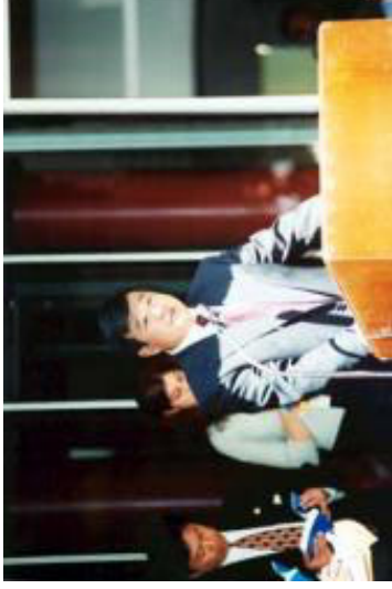
1999 年 6 月 25 日，李洪志老师在接受伊利诺伊州州长、州财政部长和芝加哥市长嘉奖的颁奖仪式上讲话（左图）。右图为来自俄罗斯的褒奖