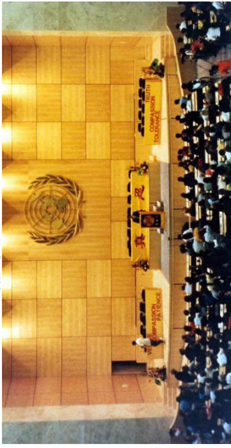
李洪志老师在瑞士法轮大法修炼心得交流会上讲法。 瑞士，日内瓦，联合国万国宫 (1998-9-4)