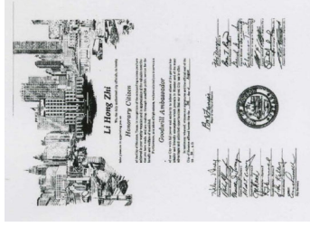
左图为来自澳大利亚的褒奖，中为来自瑞典的褒奖，右图为 1994 年 8 月 3 日美国休士顿市授予李洪志老师荣誉市民和亲善大使称号。