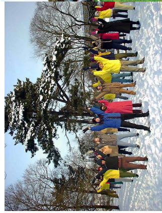
瑞典法轮功学员在集体炼功