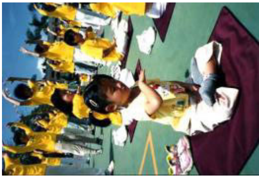
右图为台湾法轮功学员在台湾神冈乡 炼功 (2001-6)