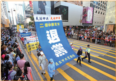
香港法輪功學員舉行大遊行，慶祝中國二億人退出中共黨、團、隊組織。沿途民眾震撼並拍照。