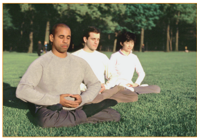
清晨，茵茵草地上，不同膚色的法輪功學員在打坐，煉法輪功第五套功法。

統計學教授吳偉標，在著名的芝加哥大學任教。他 26 歲取得博士學位，29 歲獲得美國自然科學基金授予年輕科學家的職業獎，當年全美只有少數人在統計學領域獲此獎。2009 年，獲得由諾貝爾經濟學獎得主命名的庫普曼斯計量經濟學獎。