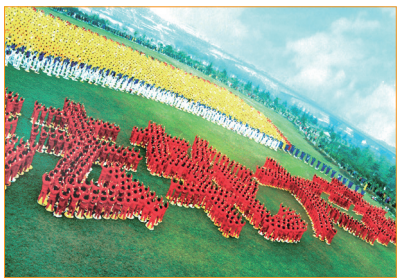
1999 年，在中國武漢市漢水公園，近萬名法輪功學員排出「法輪大法」四個大字。