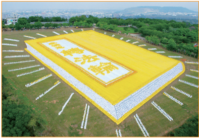
6000 多名法輪功學員在臺灣臺中縣外埔鄉排字，排出指導修煉的《轉法輪》一書的巨幅圖形。

一本弘傳 100 多個國家的書，一本超越語言、種族、文化界限，吸引了上億人的書，一本改變了無數人命運、對人類社會產生了深遠影響的書——這就是李洪志先生的著作《轉法輪》。