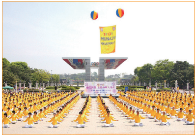
在韓國各個城市的公園、學校運動場等地方，都能看到法輪功學員集體煉功的祥和場面。