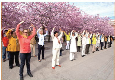
5月初，瑞典法輪功學員聚集在皇家花園美麗的櫻花樹下集體煉功，慶祝「世界法輪大法日」。