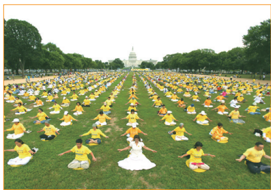
來自世界各地的數千名法輪功學員，齊聚美國華盛頓，在國會山莊前集體煉法輪功法。

法輪大法，又稱法輪功，是佛家上乘修煉大法，以宇宙特性「真、善、忍」為修煉原則，包含五套緩慢優美的功法動作。法輪功傳出後，因其神奇的祛病健身效果和教人向善的法理受到人們的歡迎，短短幾年傳遍神州大地。