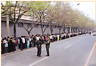
「4·25」上訪現場之一。 沒有口號、標語，沒有情緒激動。秩序井然，警察在悠閒地聊天。