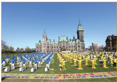
在加拿大，從總理到民眾，都對法輪功讚賞有加。圖為法輪功學員在加拿大國會山前集體煉功。