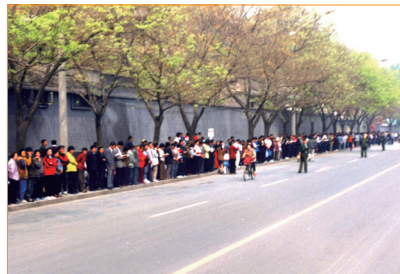
「4·25」上訪現場之二。 自始至終，上訪群眾自覺讓出人行道和車道，靜靜地看書，等待。

1999年4月11日，前中共政法委書記羅幹的連襟何祚庥在天津一雜誌上撰文攻擊誣衊法輪功。天津部分法輪功學員前往相關機構反映實情。在雜誌社得知報導失誤並承諾公開道歉及更正之際，23日和24日，天津市公安局出動防暴警察，毆打法輪功學員，致使多人流血受傷，40多人被抓。學員們被告知：公安部介入了此事，去北京才能解決問題。