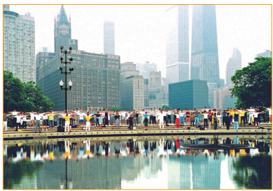
1999年6月27日，參加美國芝加哥法輪大法修煉心得交流會的學員集體晨煉。