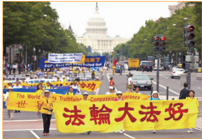
美國首都華盛頓賓夕法尼亞大道上，浩浩蕩蕩的法輪功學員遊行隊伍向人們展現法輪大法的美好。

中共罪惡累累，天要滅中共，那些忠於它的人也將受其牽連。而我們在加入少先隊、共青團、共產黨時，曾舉起右手宣誓，要「為其黨奉獻終身」，這是發了一個毒誓，就會被中共邪靈在右手和額頭上打上印記。世界上這種舉著右手發毒誓的「宣誓儀式」唯共產黨獨有。