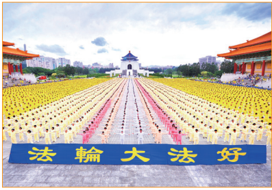
7000 多名法輪功學員在臺北自由廣場集體煉功。同根同源的臺灣，有幾十萬人修煉法輪功。