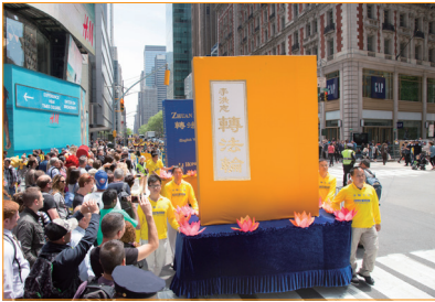
《轉法輪》是法輪功的主要著作，已被譯成 30 多種語言在世界各地發行。上圖是法輪功學員在曼哈頓大遊行。