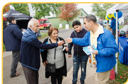
◆ 法轮功学员在和民众讲真相