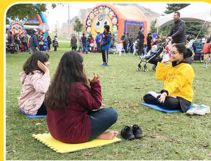
◆ 昂瑟曼女士和友人一起学功