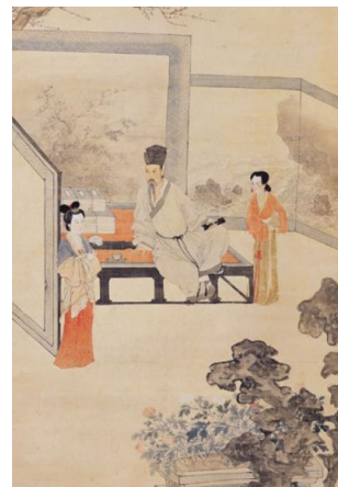
◆秀才妻向徐家人哭诉遭遇，徐上舍表示绝不逼人作妾。

一天，徐上舍在一寺庙里偶见一个小沙弥长得像极了义妹，便向寺里老僧询问小沙弥的来历。老僧叹气说道：“这孩子的叔叔沉湎于赌博，为了钱，将他拐骗离家，想将他卖给唱戏的。老僧看孩子可怜就买下了他。”就这样，徐上舍找到了义妹的儿子，又经老僧指点寻回了义妹的女儿。