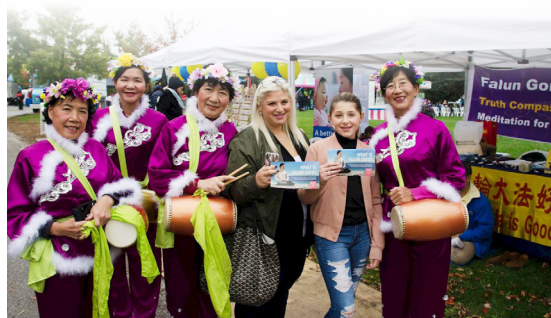
◆ 参加庆典活动的民众和学员合影