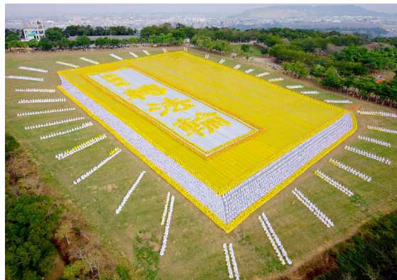
◆亚太国家六千多名法轮功学员在台湾排出《转法轮》图形。

1998年，医学界专家对近3.5万名法轮功学员进行了医学调查，调查结果显示修炼法轮功祛病健身总有效率达98%。