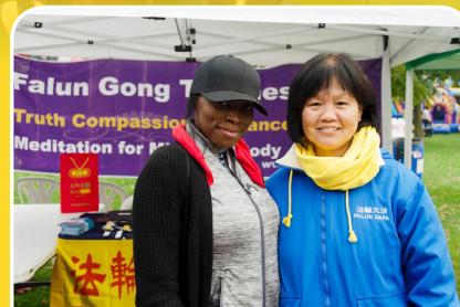
◆ 提阿娜女士和法轮功学员合影