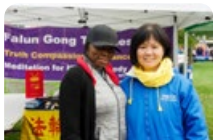
◆提阿娜女士和法轮功学员合影

一位不便透露姓名的国内某媒体记者说：“法轮功是所有功法中最好的，真、善、忍是人生的真谛，你们的遭遇是中共迫害你们造成的，我始终支持你们！”