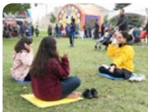
◆昂瑟曼女士和友人一起学功