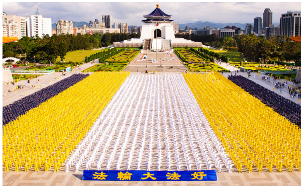
◆ 2018年11月24日，约5400名法轮功学员在台湾中正纪念堂广场集体炼功。

法轮功，又称法轮大法，是由李洪志先生于1992年5月传出的佛家上乘修炼大法，以“真、善、忍”为根本指导，包含五套缓慢优美的功法动作。