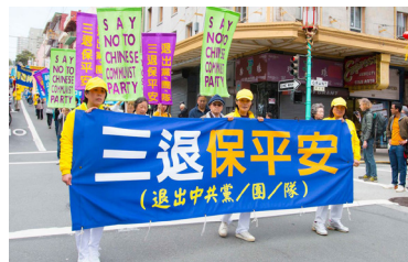
◆美国北加州退党服务中心在旧金山游行，声援三亿人三退。

现在上天要灭它，当然会连带它的成员——党员、团员、队员。所以退出中共组织，是表明自己不与邪恶为伍，是避免天灭中共时受到连累。