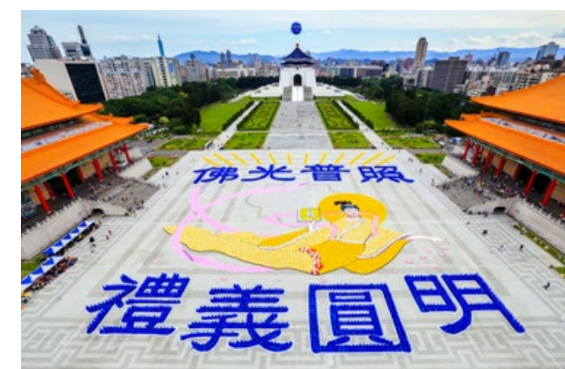
▲ 近6000名法轮功学员在台湾台北自由广场排出“佛光普照 礼义圆明”八个大字和美好画面。

吴警官说：“我觉得浑身有劲，现在和过去的状况不可同日而语，我清楚地知道自己已经脱离危险时期，我已经走过来了，没有问题了！”吴太太亲眼看到丈夫的巨大变化，感到万分惊喜，也修炼法轮功了。