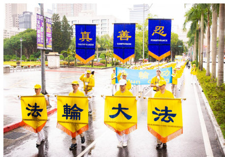
▲ 2019年7月20日，台湾部分法轮功学员，在台北市举行大游行。