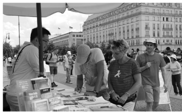
德国柏林法轮功学员在布兰登堡门前向民众讲真相。