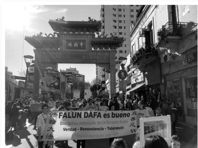
阿根廷法轮功学员在首都布宜诺斯艾利斯举办游行。