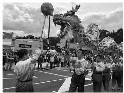
新西兰法轮功学员在沃克沃思的寇伐节上表演舞龙。