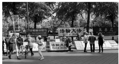
法轮功学员在海牙荷兰众议院外向民众讲真相。