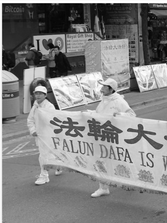
2019年10月12日，加拿大多伦多法轮