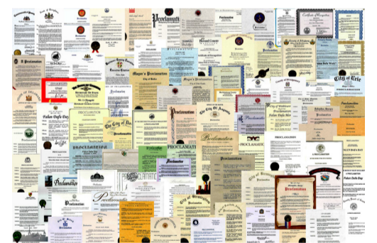
法轮大法获得各国各界褒奖、支持议案和支持信函3600多项。

北美、欧洲、亚洲、澳洲等地各级政府、议会，颁奖并高度推崇法轮功在提升道德、净化人心、强身健体与福国利民方面的卓越成果。