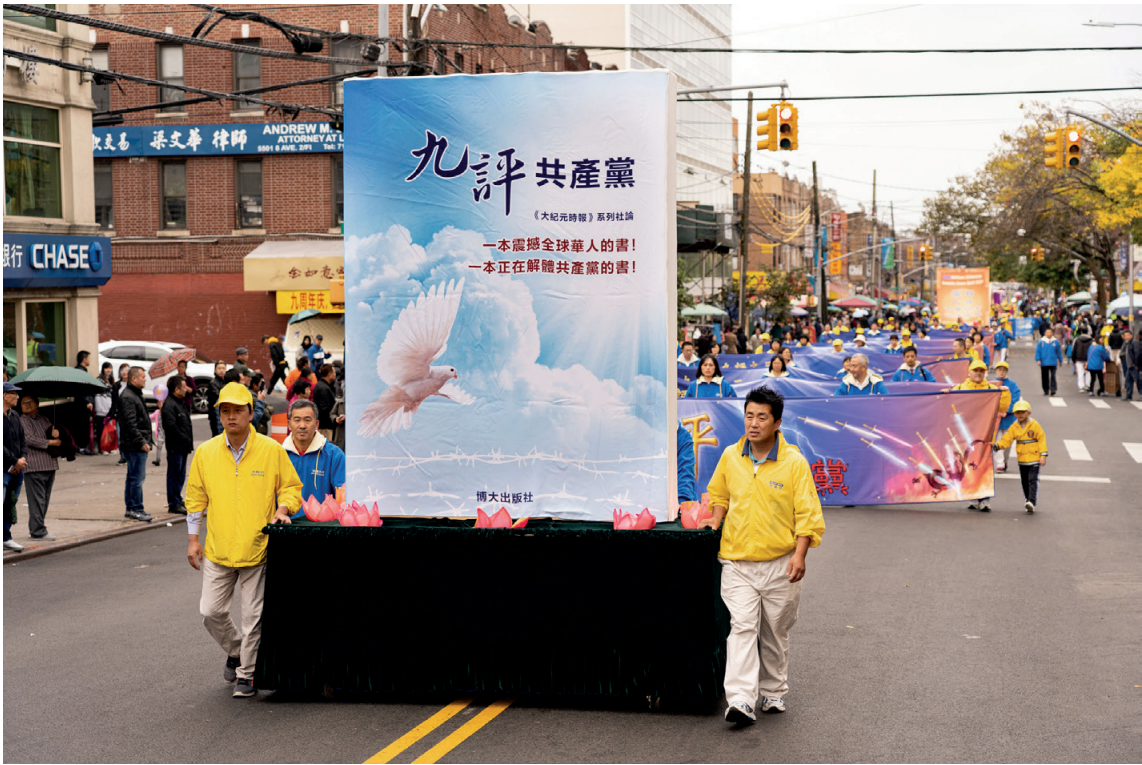
图:2019年10月20日，法轮功学员在纽约布鲁克林举行游行，声援3亿多勇士三退（退出中共党、团、队）。图为游行队伍中《九评共产党》一书的模型。

最重要，你们平安了，父母就放心了。现在到了美国，你们知道吗，美国是信神的国家，而中共是鼓吹无神论的，但是你不相信神，却不等于神不存在。中国人从小学开始戴红领巾，叫学生发誓把生命交给党，以后入团、入党反复发誓，就象我这个年龄的都发过这些毒誓。