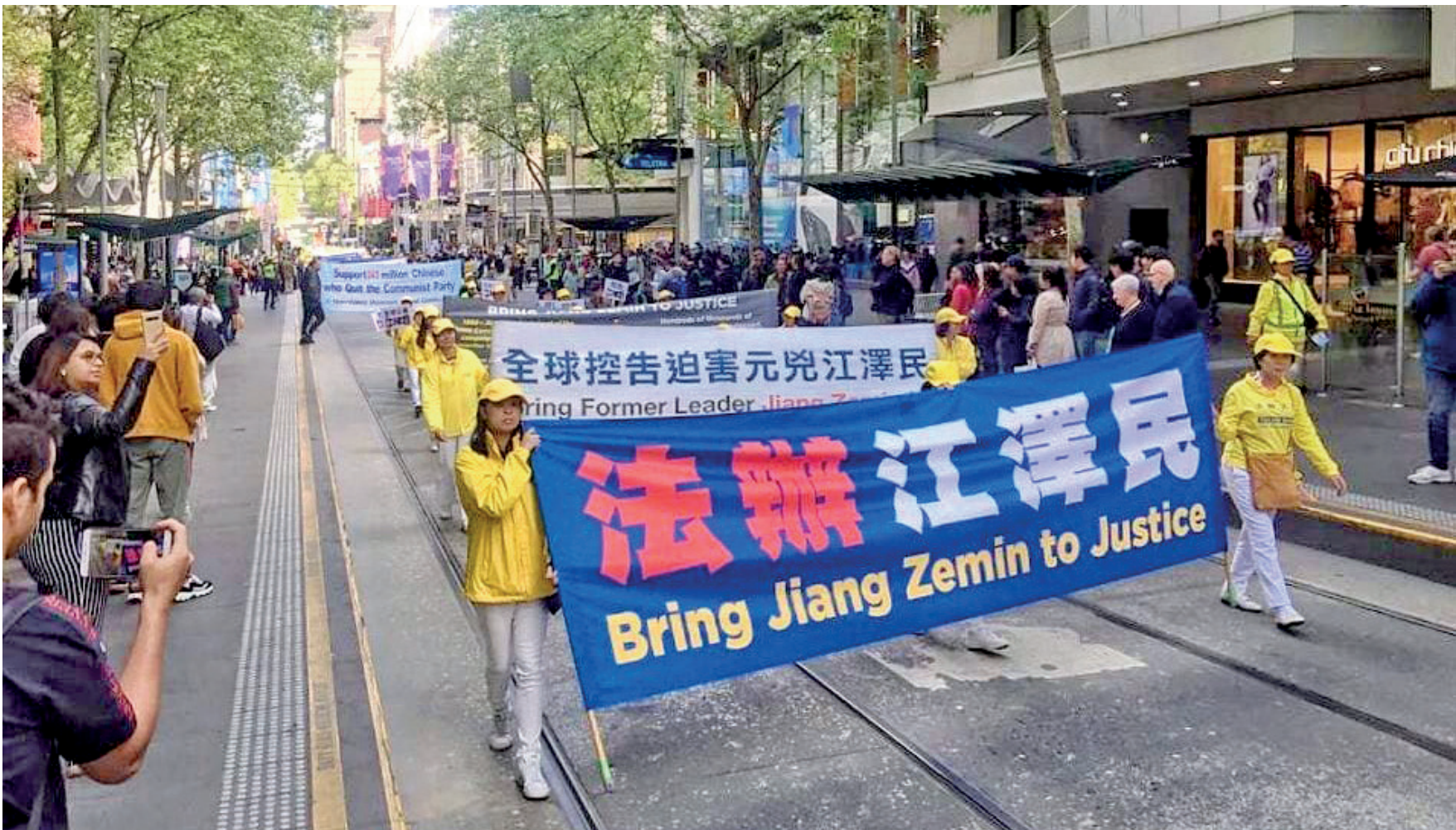
图:2019年10月11日，法轮功学员在澳洲墨尔本举行反迫害大游行，图为游行队伍中的横幅“法办江泽民”。