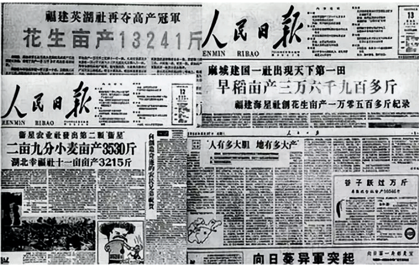
图：中共大跃进时期的造假报道。

1999 年 7 月 20 日中共与江氏集团动用整部国家机器迫害法轮功，为了实行“肉体上消灭、经济上搞垮、名誉上搞臭”的灭绝政策，不断制造“假新闻”，编造一连串自焚、杀