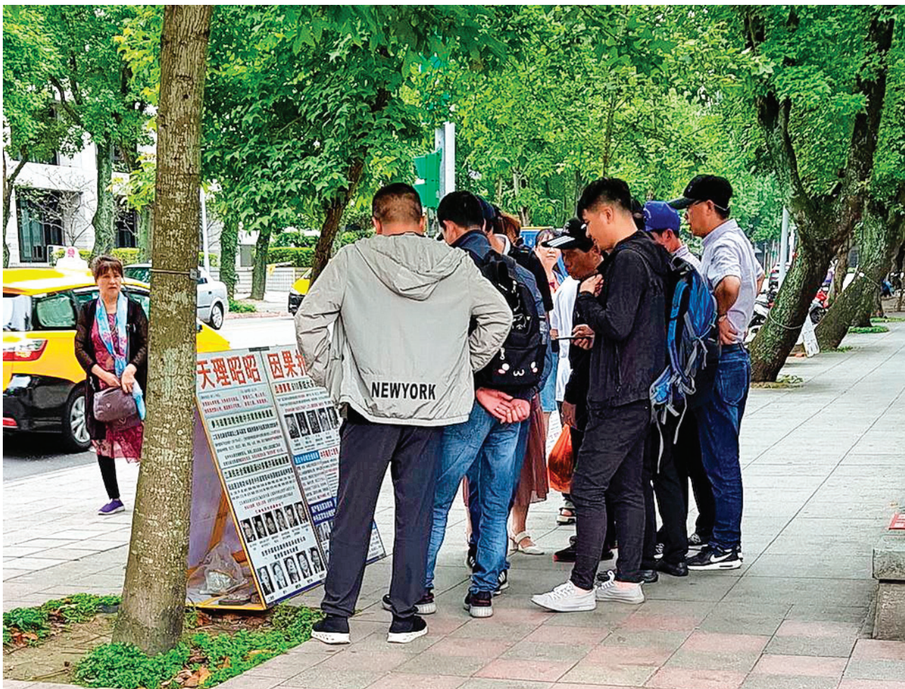
图:法轮功学员在台北国父纪念馆的园区内的真相点吸引大陆游客观看、了解真相。

功五套炼功的影带吗？原来他是做国际贸易的，全世界到处跑，也在世界各地不断与法轮功学员相遇，他已经了解了真相、今天更想进一步来学炼法轮功。