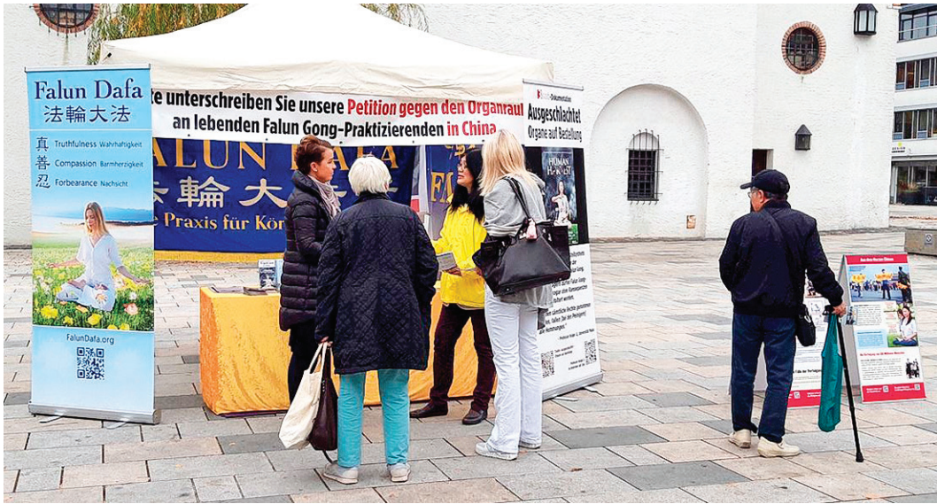
图:民众观看展板，与法轮功学员交谈，渴望了解真相。

有位德国女士看到法轮功学员信息台，跟学员攀谈，她很想知道在哪里可以学炼法轮功。她表示自己上周已经签