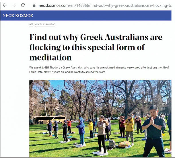
上图: 墨尔本最大的希腊裔媒体 Neos Kosmos 报道了法轮功学员修炼故事，图为网站截图。