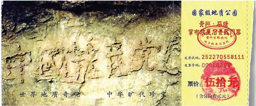
图:贵州省将平塘县藏字石景观建成国家级地质公园，图为公园门票，其中大石头上天然形成“中国共产党亡”六个大字历历可观。

细想想，发誓随时准备为中共牺牲一切？！多么恶毒的誓言？当然多数人并不愿真的为之“牺牲一切”。反过来讲，中国人自古重信义，言而有信是一个正常人的道德底线，一个连发誓都不当回事的人，当然也谈不上什么诚信、道义。