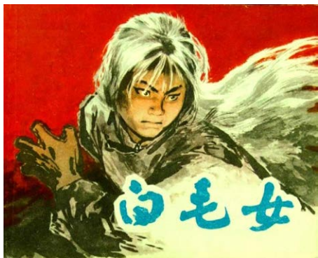
中共宣传《白毛女》煽动仇恨的连环画

很多人并不知晓，中共是出于推动土改运动，革地主命的需要，虚构了歌剧《白毛女》，颠倒黑白，煽动民众对地主的仇恨。