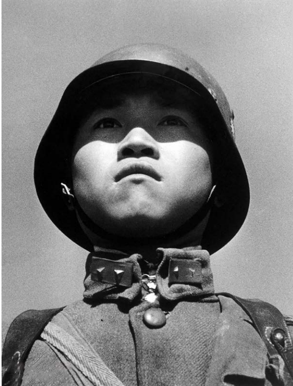
1937年，这张国民党士兵肖像成为当年《生活》杂志的封面人物，让世界了解了中国抗战的决心，赢得了广泛支持。

首先，中华民国政府是指挥全国抗战的司令部，蒋介石是指挥全国抗战的最高统帅。“西安事变”和“芦沟桥事变”发生后，中共