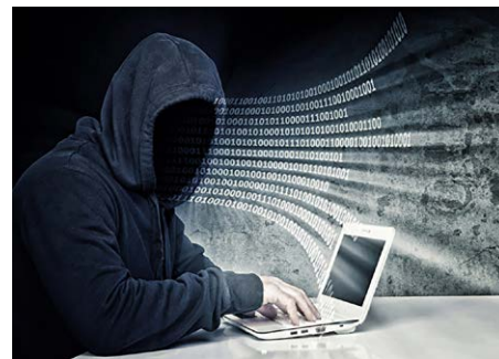
中共网络审查模式为“人机并用”

据一位中国前外交官介绍，藏人、维吾尔人、法轮功修炼者、民主人士以及支持台湾独立的五类人士是中共海外的重点打压群体。很多情况下，这些团体成为