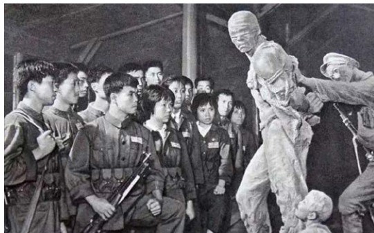
当年民兵参观《收租院》，“义愤填膺”。

真相》披露，从1981年开始，陈列馆派专人采访了70多名知情者，翻阅了大量文史档案。经过一年多的奔波，水牢人证、物证一个也没找到。庄园陈列馆向主管部门送呈的《关于“水牢”的报告》称：综合我们掌握的材料，可以初步肯定“水牢”是缺乏根据的。