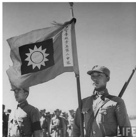
中央军校毕业的约25000名军官中，有10000名牺牲在抗战全面爆发的前4个月。

共则到“敌人后方”去发展壮大自己的力量。在延安搞整风，种鸦片，派潘汉年与日伪勾结、合作，联日抗蒋，通敌卖国。其所谓游击战更是“游而不击”，“拥蒋抗日”则是执行苏共命令要保卫苏维埃而行。日军在华毙命的129名将领之中，死于与中共作战的只有3个，其余都是死于国民政府军队手中。中共在抗战中阵亡的高级将领只有左权、杨靖宇两人，而国民党方面却有206人。