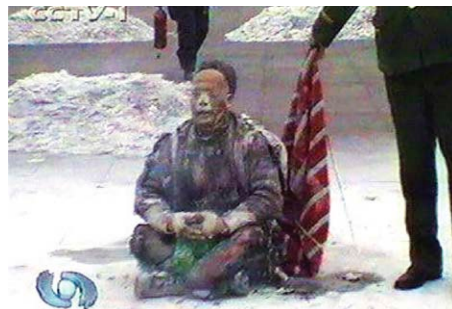
两腿间的塑料瓶翠绿如新