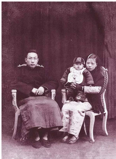
1937年冬，上海钟表匠一家合影。

在中国大陆，一提到“旧社会”，人们马上联想到“贫穷、落后、没文化、战乱不断、民不聊生……”等等词汇。果真如此吗？