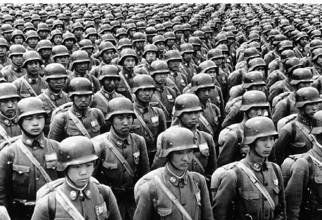
1937年，淞沪抗战前的第88德械师。精锐德械“两师一总队”3万精兵在抗战一开始就壮烈牺牲。