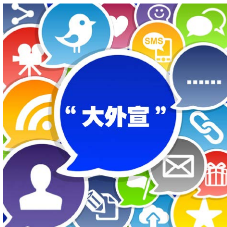
包裹着华丽外衣的中共“大外宣”

媒体。美国独立非营利机构詹姆斯通基金会 2001 年就发表了《中国政府是如何试图控制美国的华语媒体的》，披露中共主要运用四个策略来掌控美国的中文媒体：以全资或拥有主要股份的形式直接控制报纸、电视、无线广播；政府利用独立媒体在大陆的商业利益来影响这些媒体；购买广播时段或广告空间；安排中共自己的人到独立媒体工作，在内部起作用。