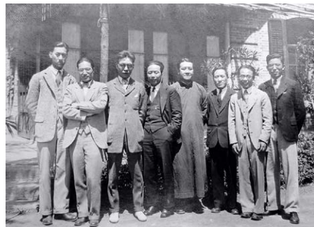
民国时期清华大学名师荟萃，左起：陈岱孙，施嘉炆，金岳霖，萨本栋，萧蓬，叶企荪，萨本铁，周培源。