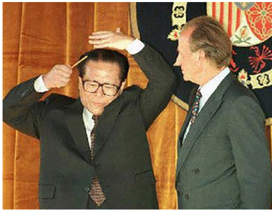
当年西班牙国王卡洛斯请江泽民一起检阅三军仪仗队时，江突然拿出一把梳子，在国王面前梳理头发，搔首弄姿。

子能够继承他父亲的遗志，’江世俊在过继仪式上说道，‘向万恶的敌人复仇。’那年，江泽民13岁。”