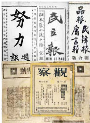
袁世凯时期的诸多报纸