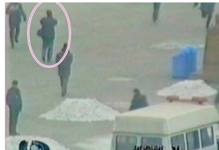
CCTV 的自焚节目中，能看到一名背摄影包的男子，在天安门广场的军警中间自由行走、拍摄。

早在 2001 年 8 月，“国际教育发展组织”就天安门自焚事件，在联合国会议上强烈谴责中共当局的“国家恐怖主义”行为，指