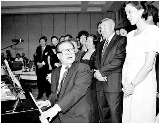
1998年7月3日，江泽民访问哈萨克斯坦时，突然弹琴唱起哈萨克民歌《可爱的一朵玫瑰花》，取悦翻译女子。

1938年3月出生的江泽慧比江泽民小11岁，假定过继给死人也成立的话，那江泽慧在江泽民