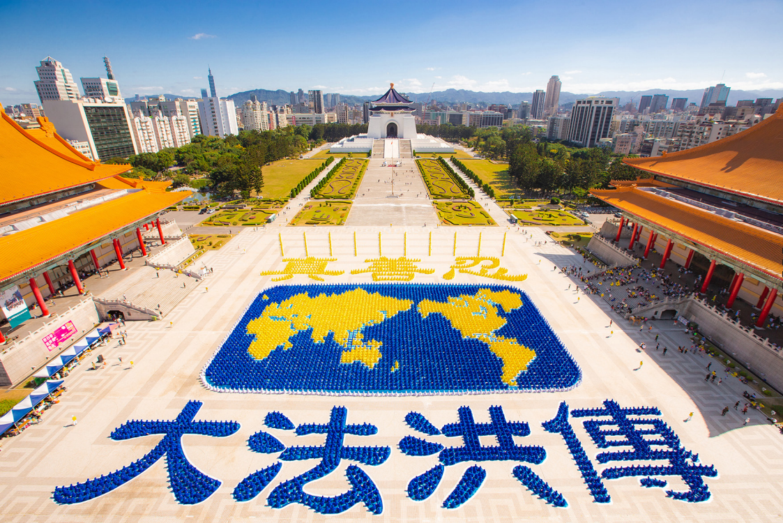
2019年11月16日，约6500名法轮功学员在台北自由广场排出展现法轮大法洪传世界的美好画面。