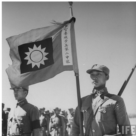
中央军校毕业的约25000名军官中，有10000名牺牲在抗战全面爆发的前4个月。

在延安搞整风，种鸦片，派潘汉年与日伪勾结、合作，联日抗蒋，通敌卖国。其所谓游击战更是“游而不击”，“拥蒋抗日”则是执行苏共命令要保卫苏维埃而行。日军在华毙命的129名将领之中，死于与中共作战的只有3个，其余都是死于国民政府军队手中。中共在抗战中阵亡的高级将领只有左权、杨靖宇两人，而国民党方面却有206人。