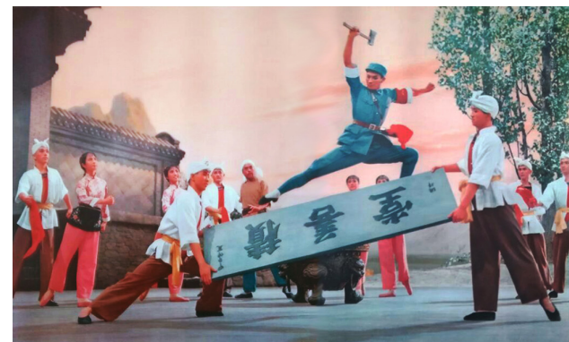
《白毛女》剧照:斧劈积善堂