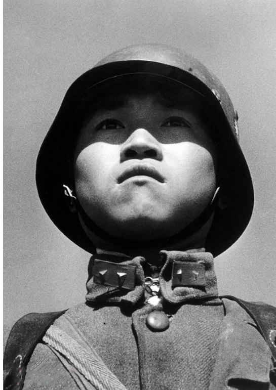
1937年，这张国民党士兵肖像成为当年《生活》杂志的封面人物，让世界了解了中国抗战的决心，赢得了广泛支持。

近年来海内外众多历史学家以大量的事实资料告诉世人，这完全是中共对中国人民的欺骗和愚弄，领导全国人民打败日本人的抗战中流砥柱不是中共，而是蒋介石领导的中华民国政府。