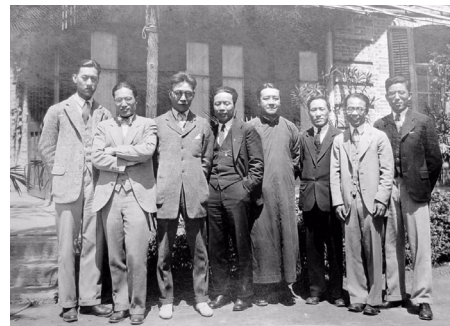
民国时期清华大学名师荟萃，左起：陈岱孙，施嘉炘，金岳霖，萨本栋，萧蓬，叶企荪，萨本铁，周培源。