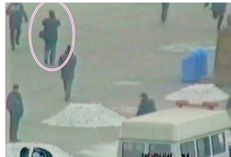
CCTV的自焚节目中，能看到一名背摄影包的男子，在天安门广场的军警中间自由行走、拍摄。

国会议上强烈谴责中共当局的“国家恐怖主义”行为，指控该事件是对法轮功的构陷，涉及惊人的阴谋与谋杀。声明说：录像分析表明，整个事件是中共“政府一手导演的”。当时，参会的中共代表团面对确凿的证据，没有辩词。