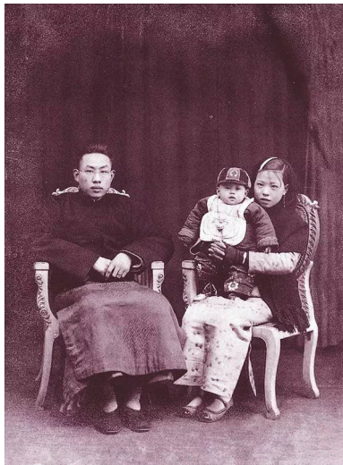
1937 年冬，上海钟表匠一家合影。

北洋政府时期，仍有内战；国民政府时期，内有悍匪战乱、外有强敌入侵。但这两个时期，中国人民的基本生活是得到保障的。除了 1942 年中日战争期间传出局部饥荒，中华民国的大部分时期，人民的温饱并不成问题。