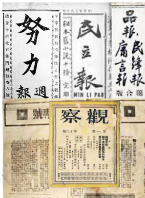
袁世凯时期的诸多报纸