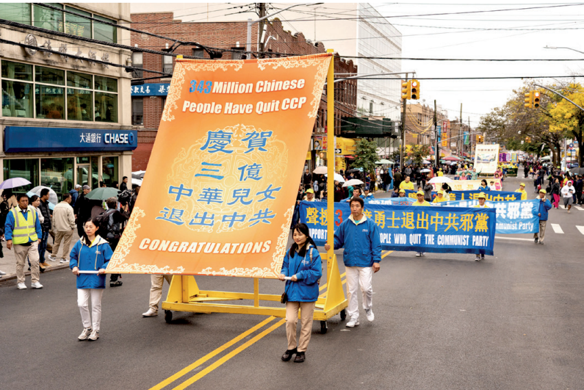
2019年10月20日，纽约部分法轮功学员在布鲁克林举行游行，声援3亿4千多万勇士三退（退出中共党、团、队）。

我说：“你先别急着说啥都不信。你说这天上的星星得有多少？它运行的规律得多么精确才能保证不相互碰撞？你再看看咱这地上，现在的水污染多严重，难怪专家们说，地球上的最后一滴水将是地球人的最后一滴眼泪。这话过份了点，可有道理啊。你出外看看，就咱中国有多少采空区？地上的资源能用多少年？你说你就信你自己，就等于说你就相信无神论，只有什么都不信