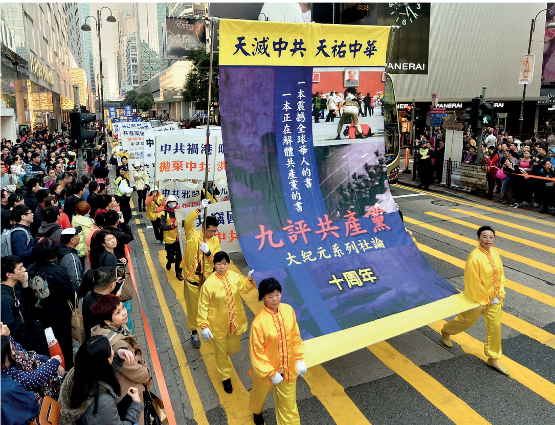
上 图:2015年1月17日，港、台、日、韩及东南亚等地的法轮功学员齐聚香港九龙，举行以“良知觉醒、解体迫害”为主题的集会游行活动。 下 图:2019年10月，香港街头标语：天灭中共。

自1999年江氏集团与中共迫害法轮功，非法将善良无辜的法轮功学员关入劳教所、监狱和洗脑班中，施以酷刑，迄今至少已有4千3百多名法轮功学员被迫害致死。大规模活体摘取法轮功学员器官、贩卖牟利并焚尸灭迹，更是人神