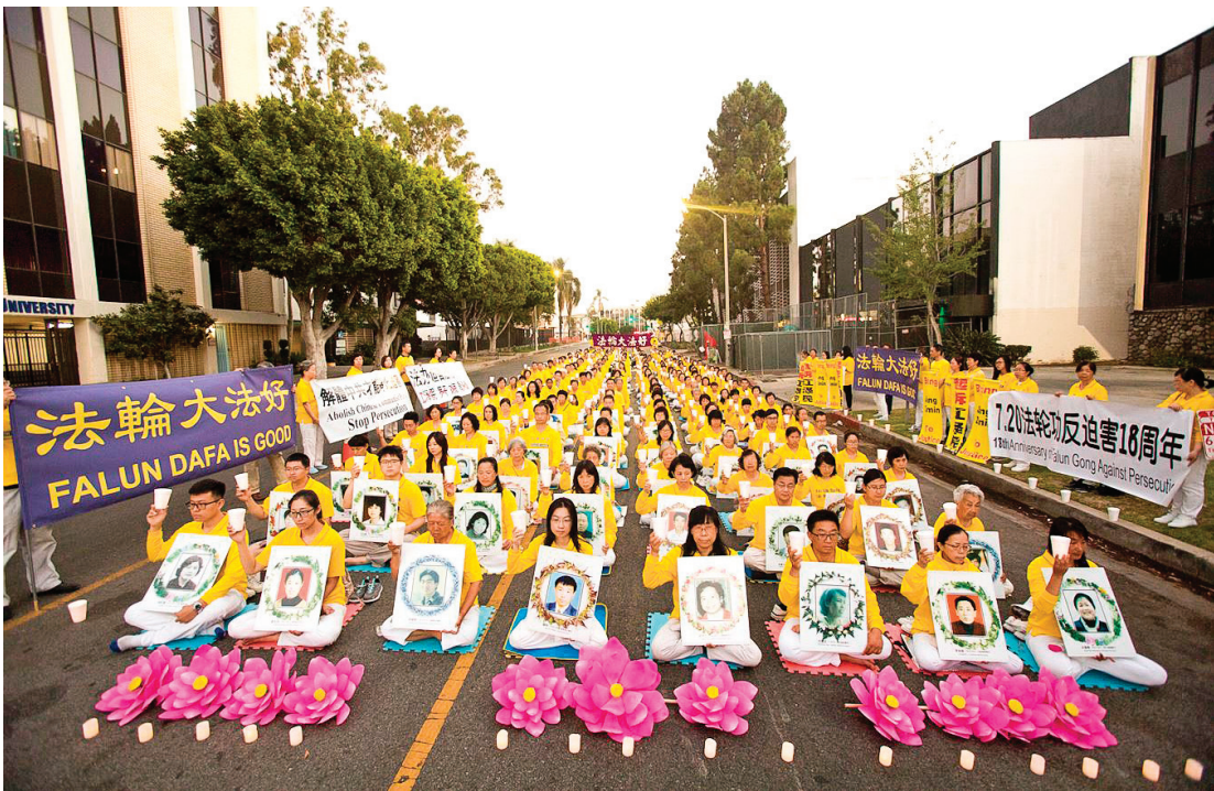
图：2017年7月20日，洛杉矶法轮功学员悼念被迫害致死的中国大陆同修。