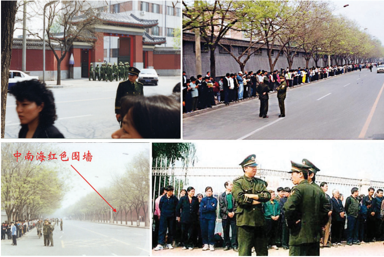
图:1999年逾万名法轮功学员和平上访。现场照片显示，上访群众静静地路边看书等待，没有“围”中南海，更没有“冲击”。

但是，中共江泽民集团为了迫害法轮功，把依法上访说成是“闹事”、“围攻中南海”，这完全是栽赃陷害。实际上，法轮功学员非常平和，既没有大声喧哗，更没有阻塞交通。对中南海，他们既没有“围