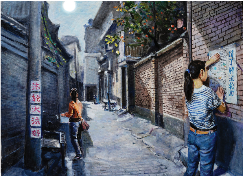
图:描述年轻法轮功弟子张贴真相的绘画。

我变得消极厌世，不明白这种痛苦来自于哪里。我找来很多哲学书看，想试着弄明白人生的意义，为什么人活着这么痛苦？但是我并没有找到答案。也许是机缘已成熟，不知