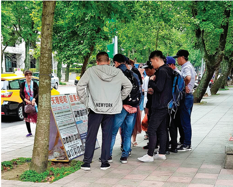
图:在台北国父纪念馆园区内的真相点，大陆游客驻足阅读展板，了解法轮功真相。

真相材料，还说：“我可以多拿几份吗？送给需要的人。”学员表示：可以可以，很感谢您！