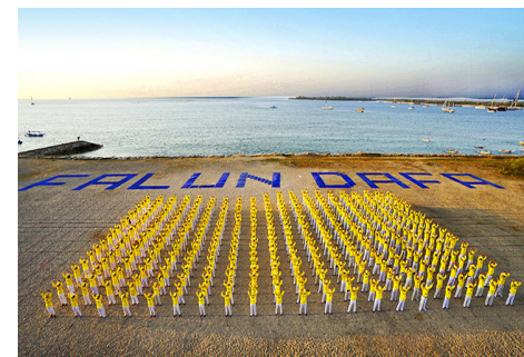
▲ 2015年9月25日,印尼法轮功学员在巴厘岛海滩排出“FALUN DAFA”巨大字形。

姚先生感叹:两岸三地同属华人世界,法轮功在台湾这么蓬勃发展,香港受到中共影响,就辛苦了些,但比起大陆还是好很多,最不可思议的是