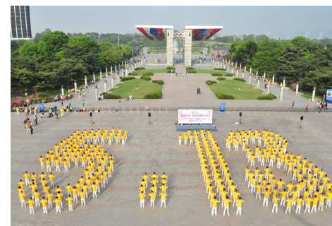
▲ 2011年5月8日,韩国首尔奥林匹克公园,法轮功学员排出“5·13”,庆祝世界法轮大法日。