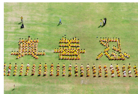
▲ 2003年5月13日,香港法轮功学员排出了“真、善、忍”字形,庆祝法轮大法传世十一周年。