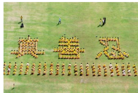
▲ 2003年5月13日，香港法轮功学员排出了“真、善、忍”字形，庆祝法轮大法传世十一周年。