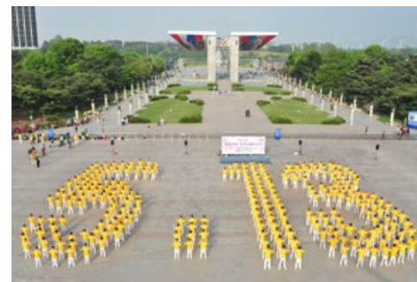
▲ 2011年5月8日，韩国首尔奥林匹克公园，法轮功学员排出“5·13”，庆祝世界法轮大法日。