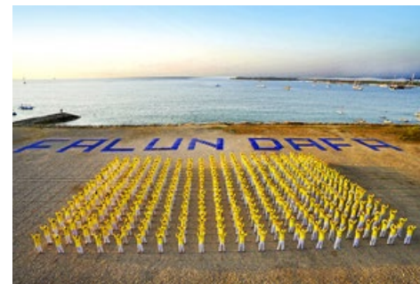
▲ 2015年9月25日，印尼法轮功学员在巴厘岛海滩排出“FALUN DAFA”巨大字形。