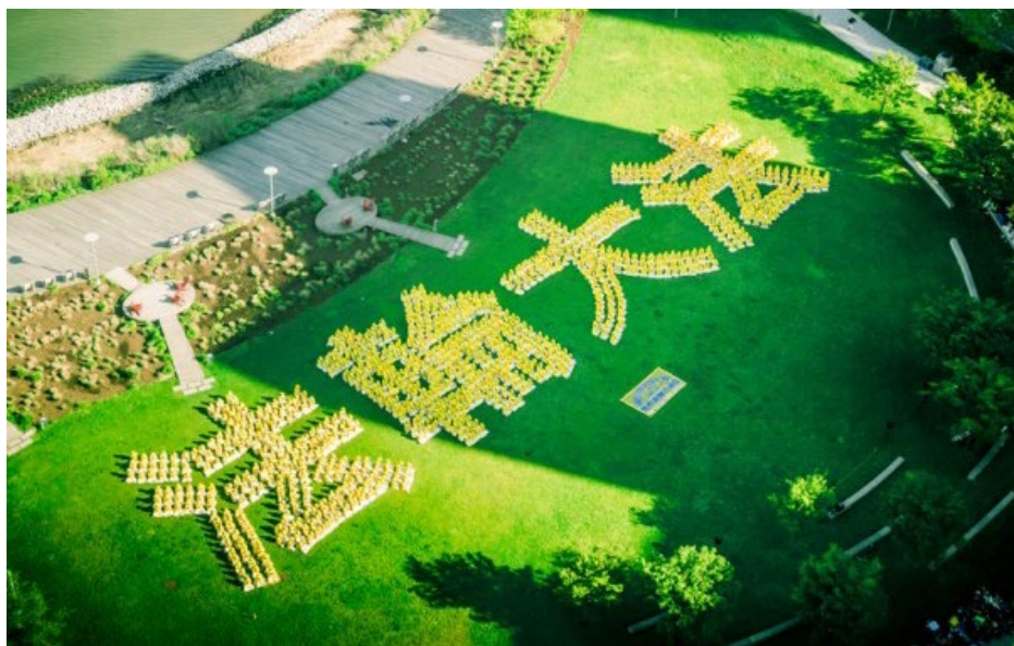
▲ 2017年9月9日,澳洲部分法轮功学员在悉尼皇家植物园排出“法正天地”四个大字(上图)。