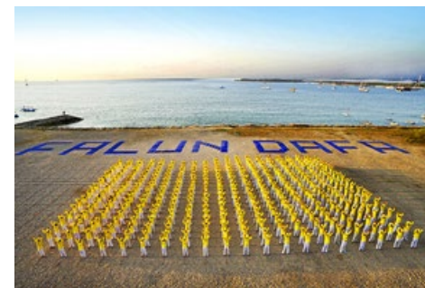
▲ 2015年9月25日,印尼法轮功学员在巴厘岛海滩排出“FALUN DAFA”巨大字形。

姚先生感叹:两岸三地同属华人世界,法轮功在台湾这么蓬勃发展,香港受到中共影响,就辛苦了些,但比起大陆还是好很多,最不可思议的是