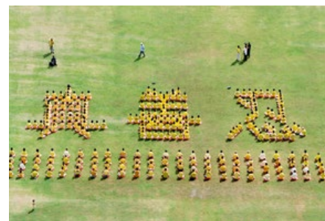
▲ 2003年5月13日,香港法轮功学员排出了“真、善、忍”字形,庆祝法轮大法传世十一周年。