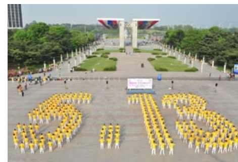
▲ 2011年5月8日,韩国首尔奥林匹克公园,法轮功学员排出“5·13”,庆祝世界法轮大法日。