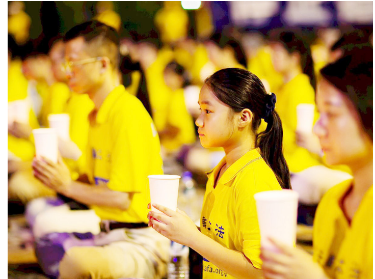
2019 年 7 月 20 日，台湾法轮功学员纪念反迫害 20 周年。

据报导，该法庭由英国大法官杰弗里·尼斯爵士（Sir Geoffrey Nice QC）主持，尼斯爵士曾主导国际刑事法庭对前南斯拉夫总统米洛舍维奇的审判。◇