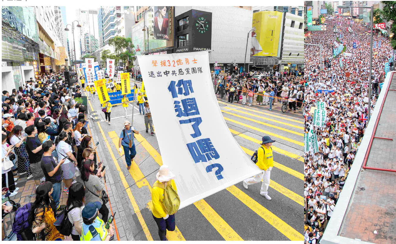
2019年5月12日，香港法轮功学员大游行，传递真相信息。