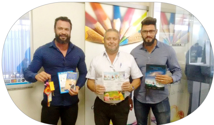
阿陆依先生和两个儿子（摄于 2019 年春）