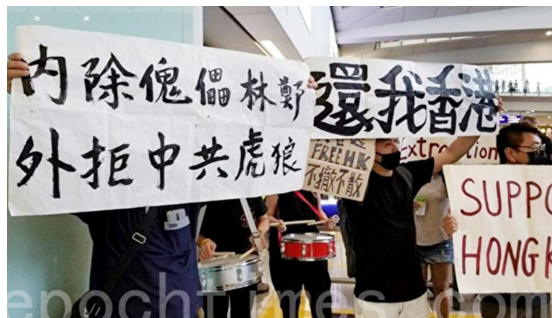
香港航空界职员7月26日集会，横幅：内除傀儡林郑，外拒中共虎狼。还我香港。