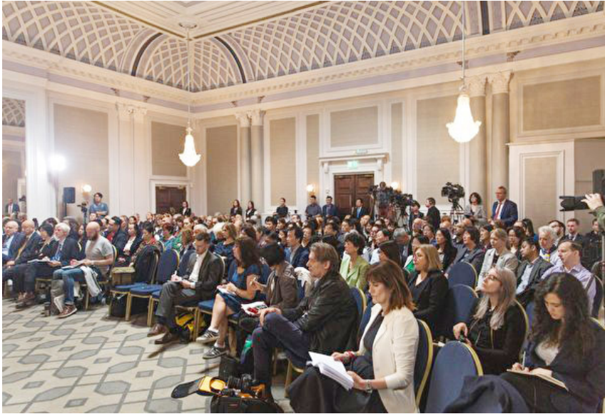
独立人民法庭在伦敦宣判，法庭内聚集了大约 200 名旁听民众和记者。