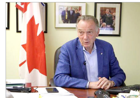
加拿大国会议员彼得·肯特：制裁人权迫害者，加拿大应比美国做得更多。

目前全球 28 个国家已经制定或准备制定类似于美国的《马格尼茨基法案》，对人权迫害者拒发签证、冻结海外资产。◇