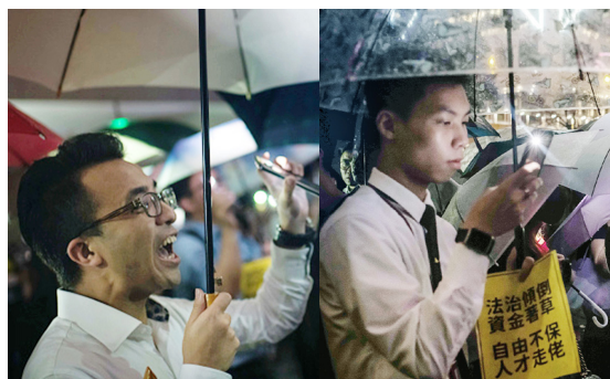
香港金融界人士，8月1日晚集会，人们手持“法治倾倒，自由不保”标语，高呼“香港人加油”、“没有暴徒只有暴政”口号。