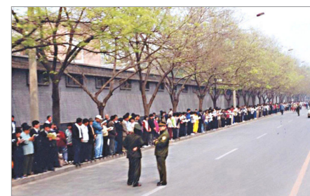
1999年4月25日上访现场秩序井然，警察不用维持秩序，在一旁聊天。

最后，终于由警察殴打及非法抓捕40多名法轮功学员的天津事件，引发1999年4月25日