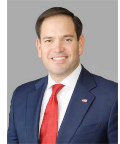
CECC 共同主席 马克·卢比奥

2019 年 7 月 20 日法轮功学员反迫害 20 周年之际，美国国会及行政当局中国委员会 (CECC) 主席麦高文议员 (Jim McGovern) 和共同主席马克·卢比奥参议员 (Marco Rubio) 发表声明，敦促中共停止迫害法轮功，释放被抓捕的法轮功学员。