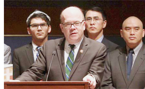
美国国会及行政当局中国委员会 (CECC) 主席麦高文议员 (中)