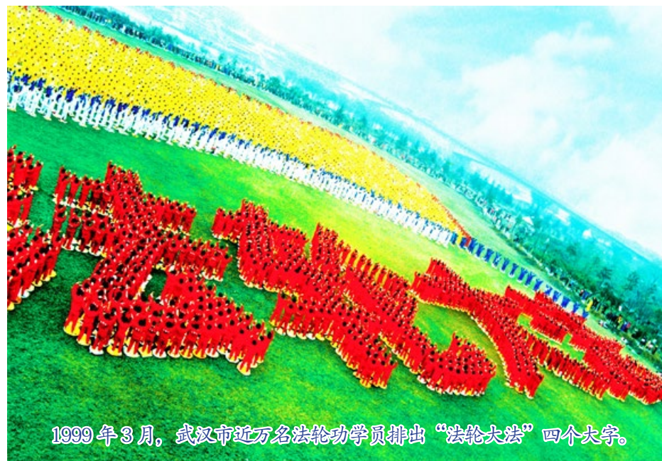
1999 年 3 月，武汉市近万名法轮功学员排出“法轮大法”四个大字。

法轮功自 1992 年 5 月 13 日由李洪志先生从中国长春传出，至今已弘传世界 100 多个国家，获各国政府褒奖、支持议案、支持信函 3600 多项，有上亿人修炼。法轮功主要著作《转法轮》已有 40 种文字的版本。法轮大法的各种书籍，可以在法轮大法网站 FalunDafa.org 免费下载（需突破网络封锁，上网方法见封底）。◇