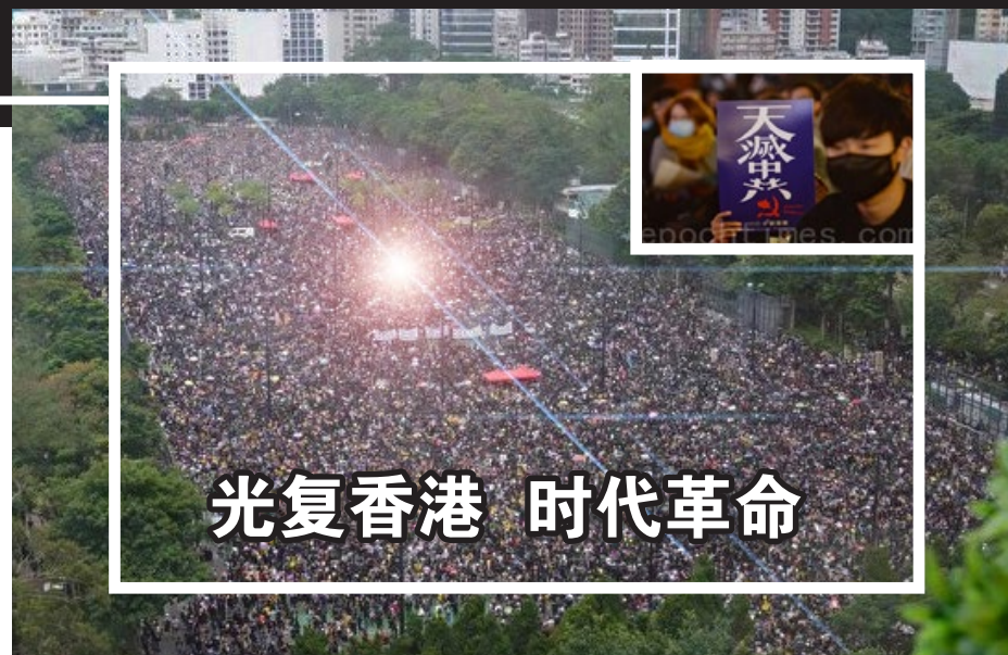
▲ 2019年8月18日,170万香港人游行,争取五大诉求。

如今香港的动荡和冲突,就如同《九评》所言,“拥有几百万军队和武警的中共,才是中国真正的‘动乱’之源。老百姓没有理由去‘动乱’,更没有资格去‘动乱’。”《九评》早就预