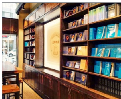
纽约法轮大法书籍专营店天梯书店

这表明：法轮功书籍在中国一直都是合法的。公民拥有、阅读和传播法轮功书籍也是合法的。◇