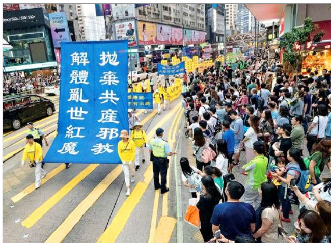
2019年4月27日，香港法轮功学员大游行传真相，声援3亿多中国人退出中共的党团组织。

当年，苏联从最高领导人到平民，普遍认识到共产党的邪恶，共同抛弃了苏共。今天，中共的罪恶仍被高层掩盖。当权者也许会误导国民步入迷途，但是在“天灭中共”的天意之下，上天也给人指明了希望的路。