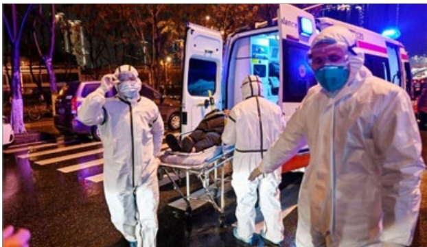
2020年1月25日，武汉医务人员正在运送病人。