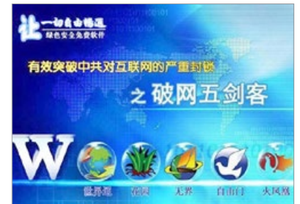
法轮功学员研发的翻墙软件，是大陆人突破网络封锁的重要工具。

少合作，比如在美国国会举办听证会，共同进行公开的抗议活动等。杨建利说：“他们不是仅仅写文章发评论，而是建立了媒体，包括大纪元报纸、新唐人电视台还有电台，这是其他反抗力量没有做到的。法轮功学员还研制了很多翻墙软件，这对中国产生了非常深刻的影响。”