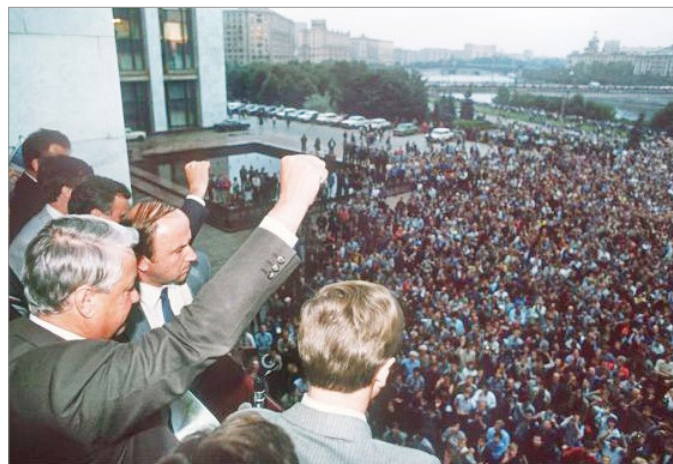
1991年8月19日，俄罗斯总统叶利钦在莫斯科号召民众抵制“保党派”的政变，获得市民支持响应。

1988年，戈尔巴乔夫宣布苏联停止对外干涉。这一举措促成“东欧剧变”。以往苏联一直干涉东欧国家的变革。而今这些国家纷纷抛弃共产党，和平转型。