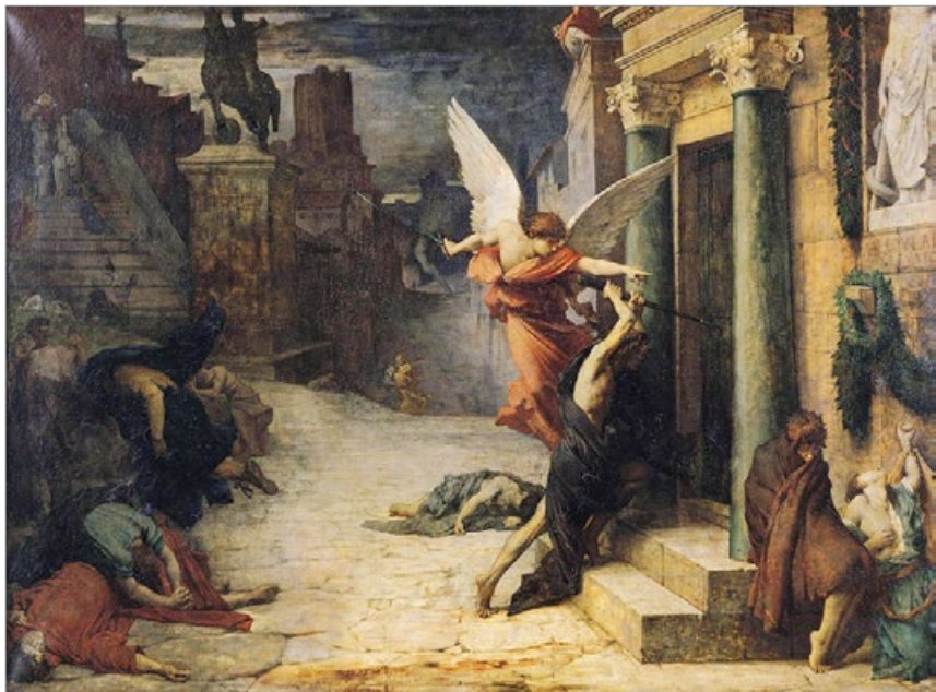
油画《被瘟疫侵袭的罗马城》，[法]居勒-埃里·德洛内，作于1869年，巴黎奥塞美术馆藏。画作描述了古罗马大瘟疫的场景，天使指点瘟神上门。史学家记载，罗马皇帝迫害基督徒，误导民众仇视信神者，招致瘟疫降临。