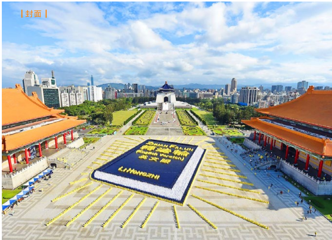
5000 多名法轮功学员在台北自由广场排组巨幅的《转法轮》英文版书籍图形，场面壮观殊胜。（摄于 2018 年 11 月 24 日）