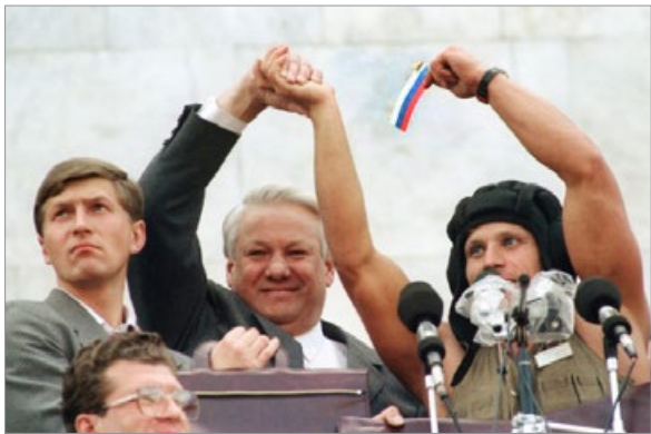
1991 年 8 月 22 日，军人和市民与叶利钦（中）在莫斯科庆祝抛弃苏联共产党。

早在 1990 年 7 月，苏共召开“二十八大”时，俄罗斯总统叶利钦就宣布退党。苏共解体前，发生了退党潮，400 万党员退党。