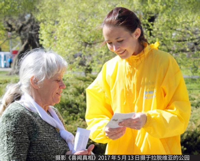
摄影《喜闻真相》2017年5月13日摄于拉脱维亚的公园