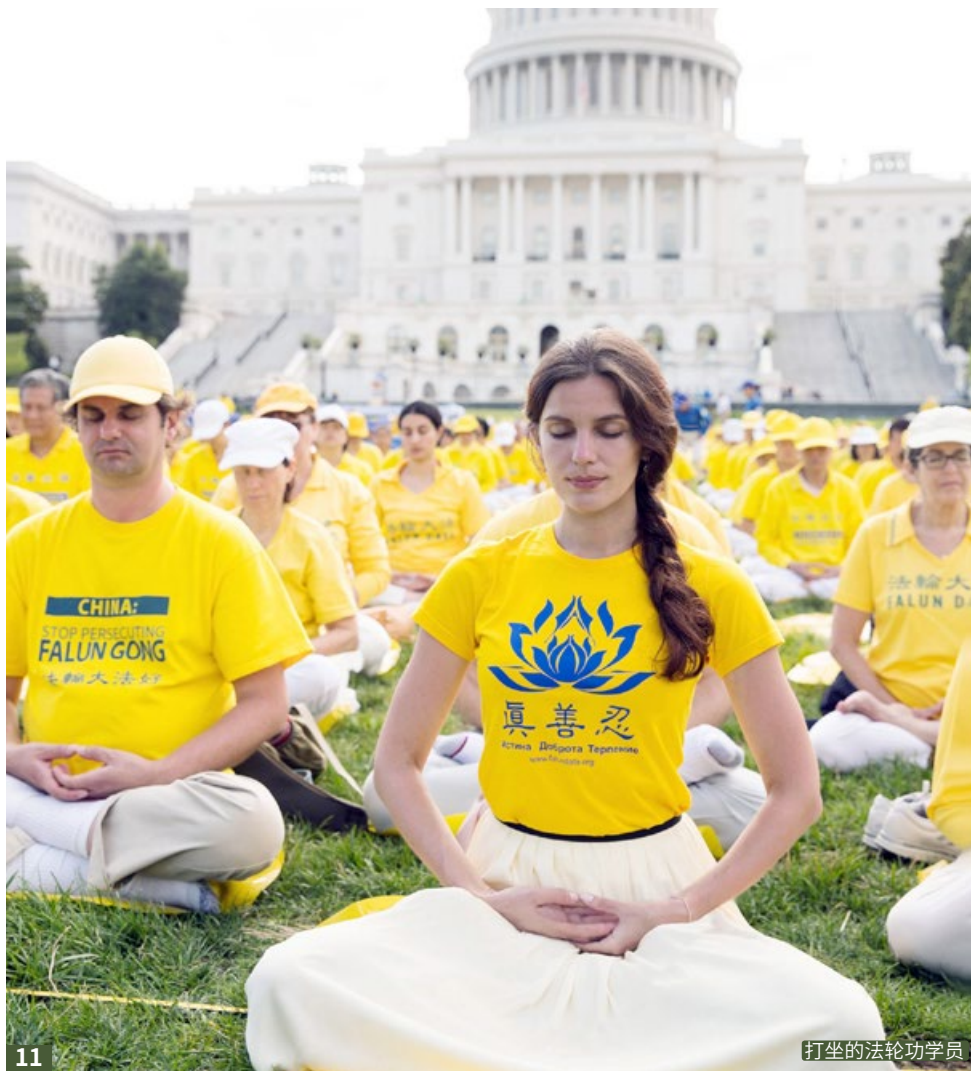
打坐的法輪功學員