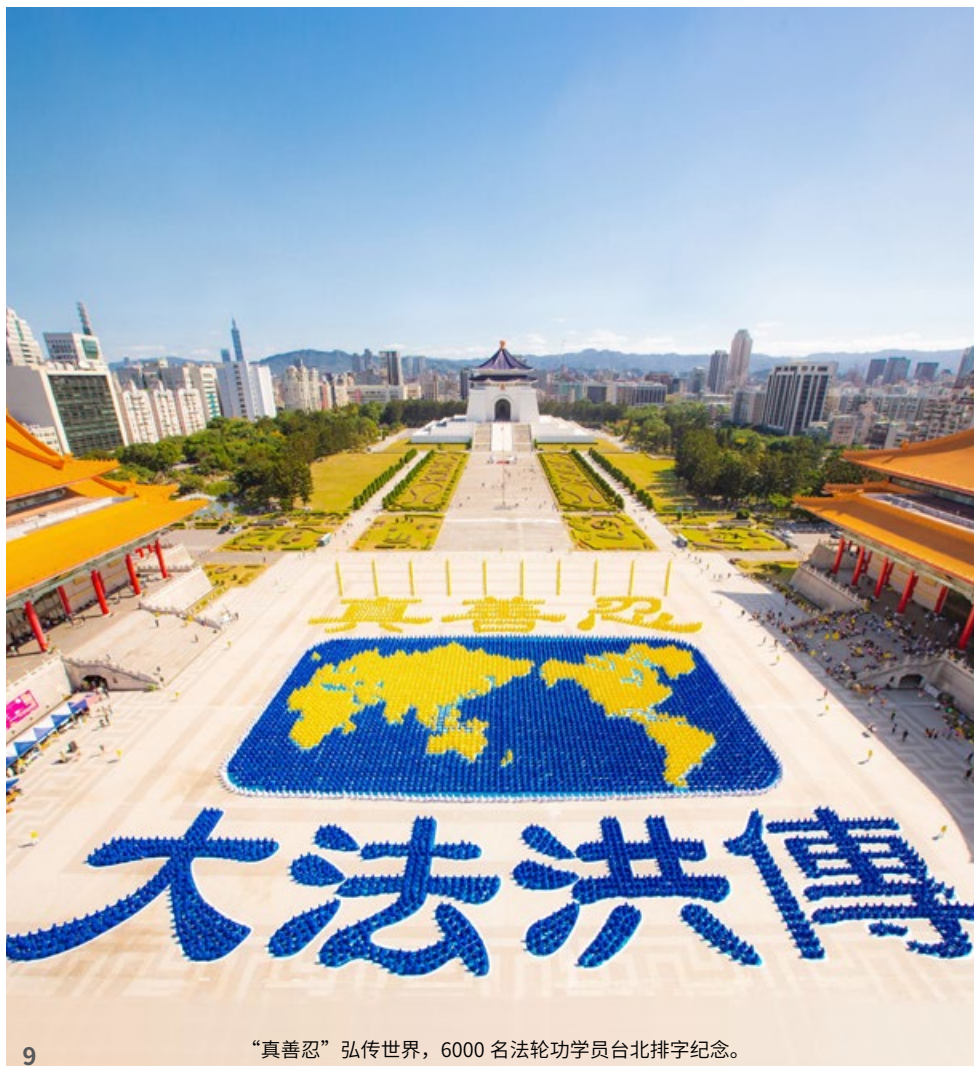
“真善忍”弘传世界，6000 名法轮功学员台北排字纪念。