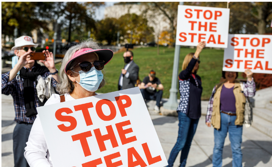
美国人反对窃选，为维护自由发声。