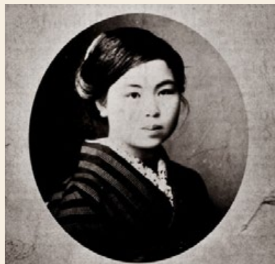
在日本明治时代拥有天目的年轻女子御船千鹤子