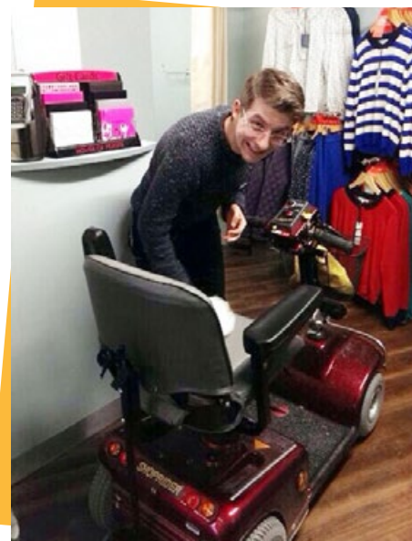
卡梅伦把老人落在雨中的代步车弄进屋里擦干净

他说：“在这个人们喜爱自拍并在网上炫耀新手提包或名表照片的世界，人们只想到自己，忘了考虑他人。我们这一代已经忘了关怀