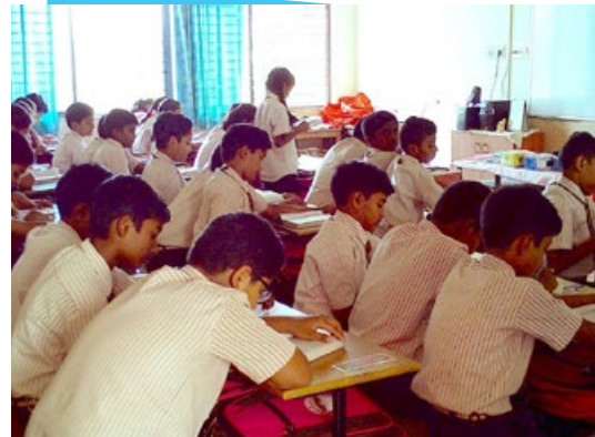
▲ 骄狄英语中学高年级的学生在各自的课堂里读《转法轮》

文章还介绍，法轮大法有五套简单的功法，炼功时间不需要固定；功法动作缓慢、易学。修炼法轮大法不仅可以强身健体，而且心灵会