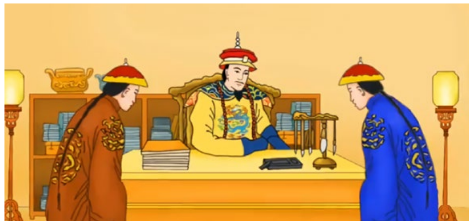
▲ 康熙帝教育皇子（视频截图）