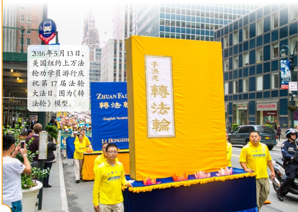
2016年5月13日，美国纽约上万法轮功学员游行庆祝第17届法轮大法日。图为《转法轮》模型。